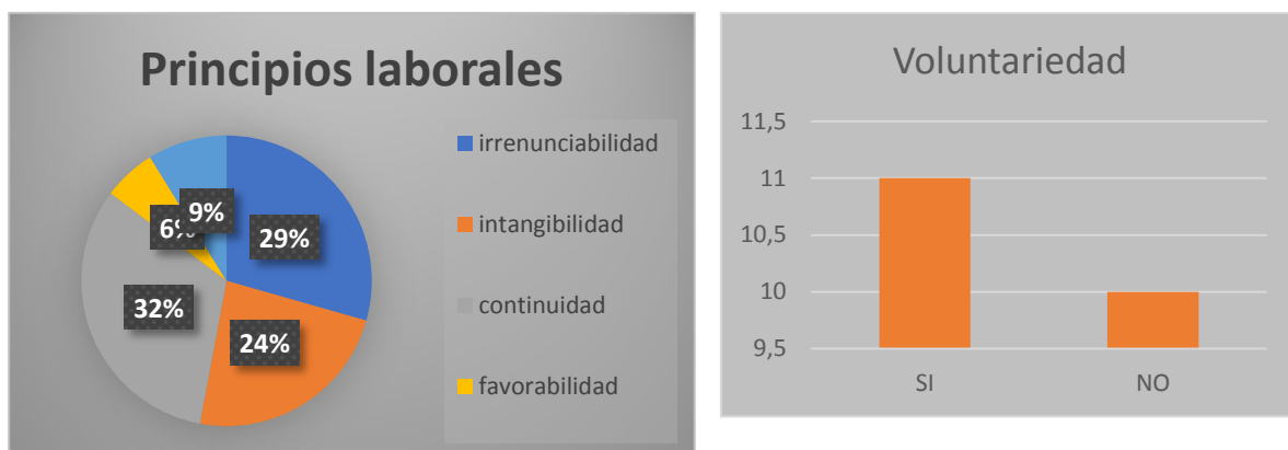
Gráfico Nº 1: Principios vulnerados en la terminación de la relación laboral.