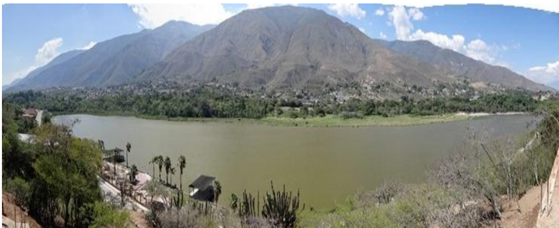
Figura N° 1. Laguna de Urao, Municipio Sucre, Estado Mérida, Venezuela.

ubicar al lector, es común afirmar que la Laguna de Urao se encuentra en el perímetro urbano de la población de Lagunillas, capital del municipio Sucre (Guerrero y Contreras, 2018).