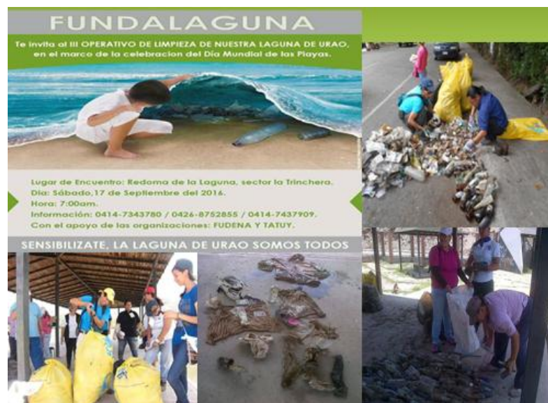
Figura N° 6. Jornadas de saneamiento de la Laguna de Urao, Municipio Sucre, Estado Mérida, Venezuela.

Muchas otras iniciativas se han practicado, tales como las Jornadas educativas con la implementación del proyecto de Ecocharlas - talleres dirigidos a niños, adolescentes y comunidades- y la aplicación de la filosofía "Aprender Haciendo"; en dicho proyecto primero se enseña la teoría y luego la práctica, para finalizar con la visita In Situ al Monumento Nacional Laguna de Urao, con la