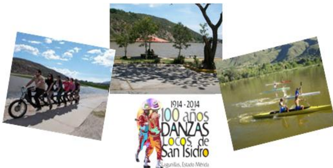
Figura N° 5. Actividades deportivas y culturales en torno a la Laguna de Urao, Municipio Sucre, Estado Mérida, Venezuela.

Dado que el calentamiento global, el desvío de agua que alimenta la laguna y la tala de árboles, han sido los principales factores por los cuales se ha evaporado aceleradamente la Laguna de Urao, desde el año 2020, FUNDALAGUNA en conjunto con el Instituto Merideño de Desarrollo Rural, y la alcaldía del municipio Sucre del estado Mérida, han avanzado en el proyecto "Siembra Agua para la Laguna de Urao", para devolverle al monumento natural la belleza y sitio de honor de hace algunos años, como principal reservorio acuífero de la zona.