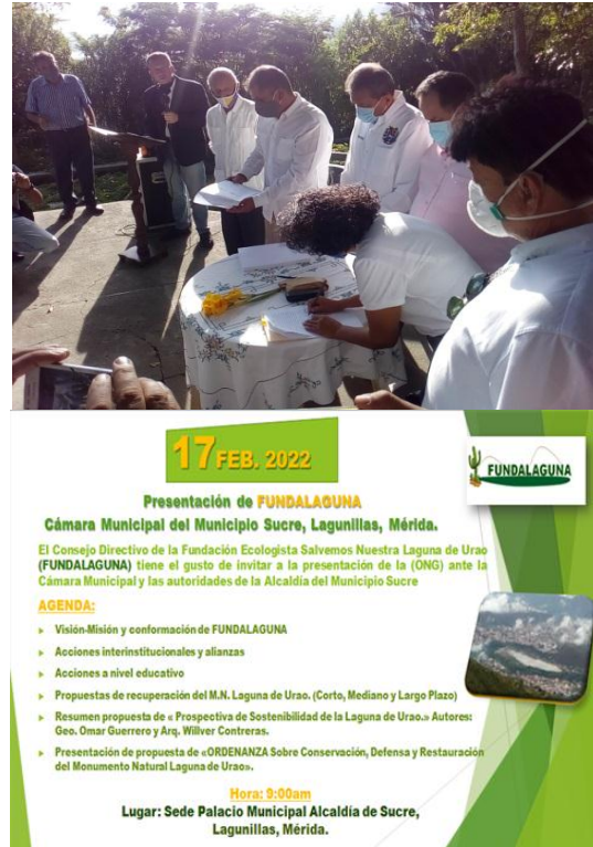
Figura N° 7. Algunos de los proyectos presentados por Fundalaguna.

sector noreste; la propuesta de estabilización de talud y paisajismo Cerro San Benito; y por último el proyecto Geoparque Laguna de Urao.