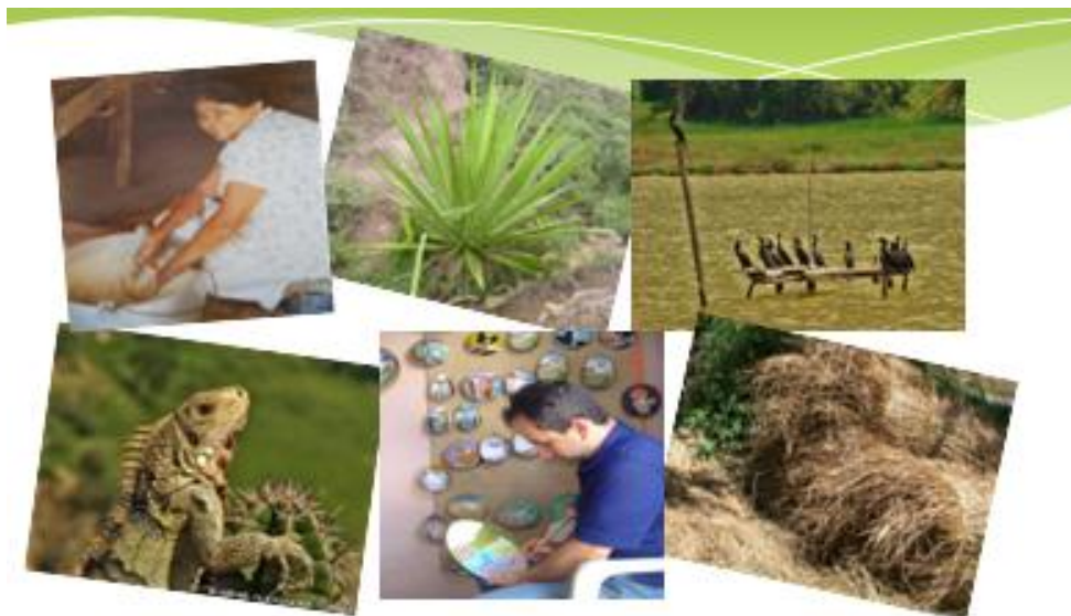
Figura N° 2. Fauna, flora y actividades alrededor de la Laguna de Urao, Municipio Sucre, Estado Mérida, Venezuela.

para hacer las esteras y con el sisal se hacen cabuyas y alpargatas de fique, materiales y productos importantes para la artesanía local.