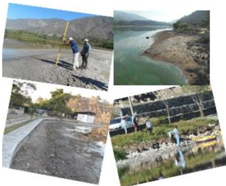
Figura N° 4. Vista superficial de la reducción del espejo de agua de la Laguna de Urao, Municipio Sucre, Estado Mérida, Venezuela.

Todo lo anterior pone en riesgo, no solo la supervivencia y sostenibilidad de la fauna, flora y otros elementos del ecosistema natural sino también, según Morillo (2019), la sostenibilidad de las diversas alternativas de ofertas turísticas que ofrece el municipio Sucre en sus cinco parroquias, tales como el turismo de salud, cultural, el geoturismo, el turismo gastronómico, el turismo deportivo con las prácticas de parapente y remo (Figura n° 5). De hecho según lo indicó Flores (2021a), esta laguna que estaba rodeada de un parque que servía como balneario y que llegó a convertirse en un importante atractivo turístico natural merideño, para la práctica de canotaje y natación aficionada, actualmente se encuentra en total abandono, a punto de desaparecer, y sus espacios son usados como potreros.