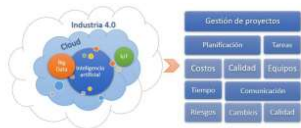
Figura 1. Alcance de la inteligencia artificial en la gestión de proyectos

d. Finalmente, Internet of Things (IoT) o internet de las cosas describe la red de objetos físicos que incorporan sensores, software y otras tecnologías con el fin de conectar e intercambiar datos con otros dispositivos y sistemas a través de Internet. Estos dispositivos van desde objetos domésticos comunes hasta herramientas industriales sofisticadas, con lo que es posible conectar a internet objetos cotidianos (electrodomésticos de cocina, automóviles, termostatos, monitores de vigilancia para bebés, etc.) a través de dispositivos integrados, permitiendo la comunicación perfecta entre personas, procesos y cosas. Oracle (2021). La figura 1 esboza el alcance de estas tecnologías en aspectos relacionados a la gestión de proyectos