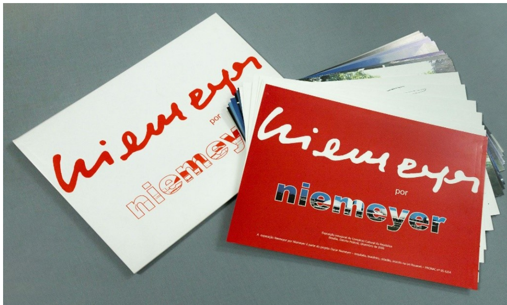
Figura 3 - Catálogo “Niemeyer por Niemeyer”, exposição inaugural do Complexo Cultural da República, 2006

Voltando à data de inauguração do Museu Nacional da República, rememoramos a primeira exposição realizada ali em comemoração ao 99º aniversário de Oscar Niemeyer: “Niemeyer por Niemeyer”, com fotografias, maquetes e desenhos das principais obras do arquiteto em seus mais de 70 anos de carreira. A exposição foi inaugurada com uma cerimônia solene e presença do presidente da República, da governadora do Distrito Federal à época e do governador que a antecedeu no dia 15 de dezembro de 2006. Essa mostra esteve aberta à visitação na Galeria Principal e no Mezanino do MuN até 21 de abril do ano seguinte. O conjunto de obras em exposição, entretanto, não constituía acervo da instituição. Destaca-se o fato de que, na ocasião de sua inauguração, o MuN não possuía acervo e que nem mesmo essa coleção, embora tenha composto o marco inicial da instituição, permaneceu em sua guarda. Tratava-se de acervo pessoal do próprio Niemeyer, reunido e organizado especialmente para aquela ocasião pelo curador carioca Marcus Lontra, enteado do arquiteto e Kadu Niemeyer, neto daquele. O que ainda hoje existe no MuN sobre essa exposição é o catálogo que foi produzido para a inauguração, em formato de 25 folhas soltas em papel cartão, com fotografias e texto curatorial, envoltas em um grande envelope.