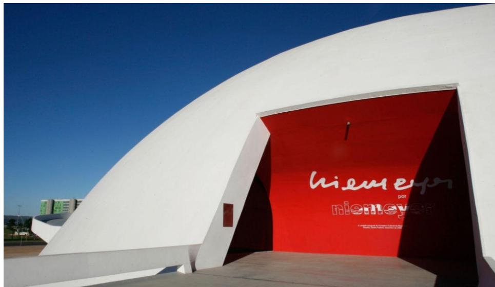
Figura 4 - Fachada do Museu Nacional da República com sinalização da exposição “Niemeyer por Niemeyer”