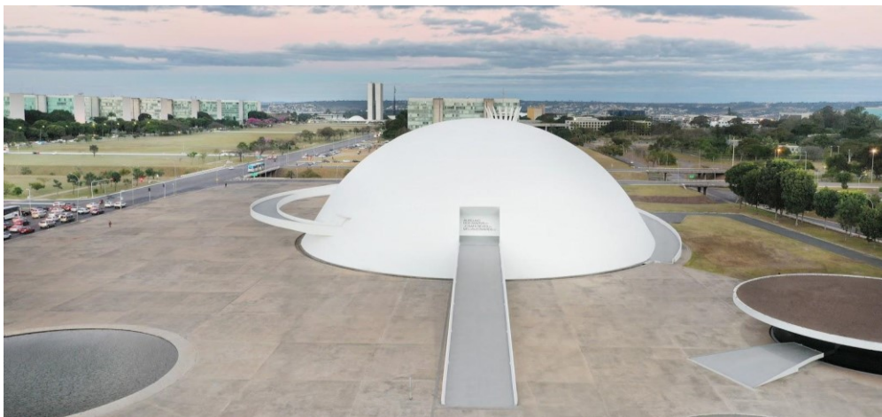
Figura 1 - Museu Nacional da República, vista da Praça do Conjunto Cultural da República