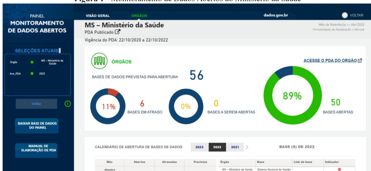
Figura 1 - Monitoramento de Dados Abertos do Ministério da Saúde