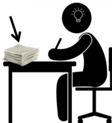
Figura 2 - Informação como coisa

Fonte: Elaborada pela autora, baseada em Buckland (1991) e Pngwing (c2022).