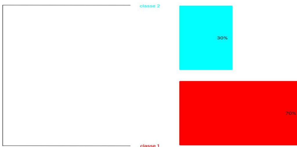
Figura 2 - Categorias obtidas com Iramuteq