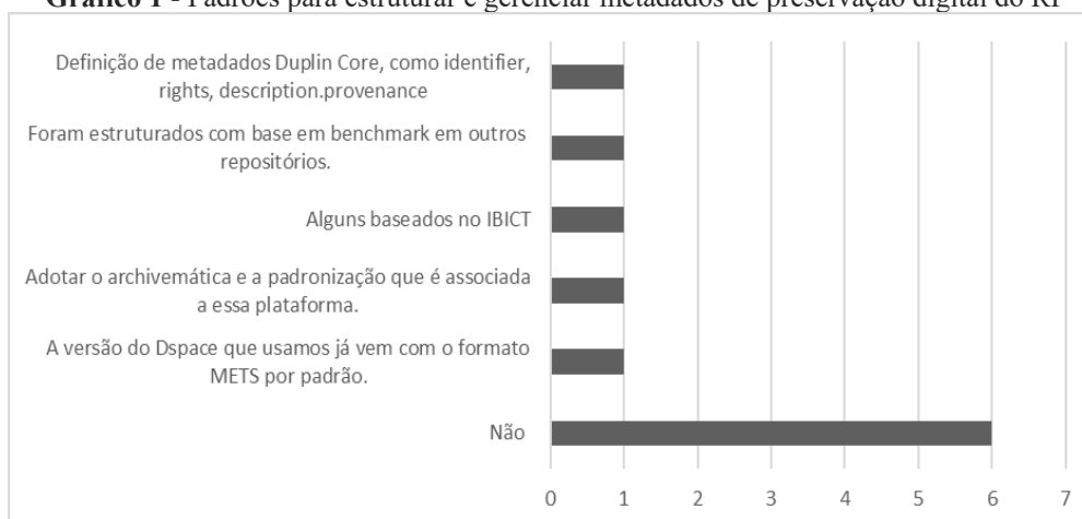
Gráfico 1 - Padrões para estruturar e gerenciar metadados de preservação digital do RI

Os padrões adotados de metadados de preservação foram os seguintes: