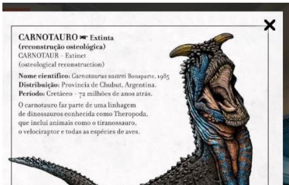
Figura 2 - Exemplos de textos da exposição virtual Biodiversidade: conhecer para preservar , do MZUSP