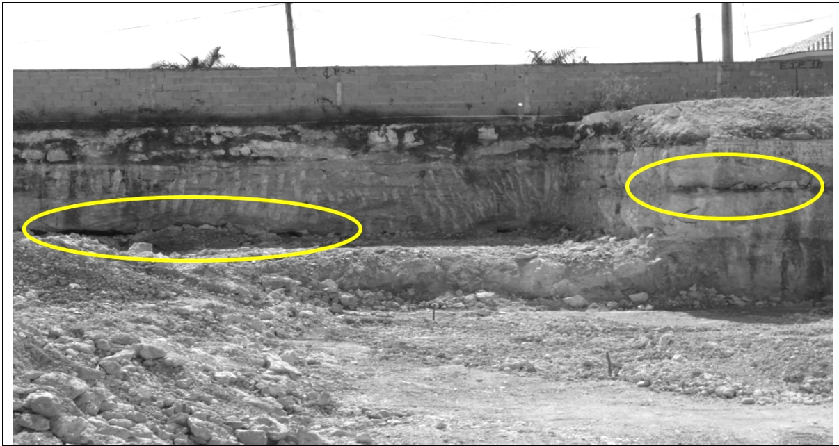
Figura 1.- En la fotografía se presenta un perfil aflorante donde se señalan los horizontes kársticos (círculos), a diferente profundidad, en la zona no saturada.

durante el cual existe la probabilidad de que se presente un evento que iguale o supere al de diseño (Cullen & Frey 1999; Stephenson A. & E. Gilleland 2006, Delignette-Muller & Dutang 2015).