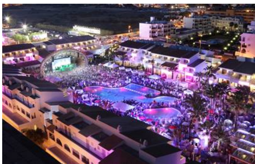
FIGURA 2 Ushuaïa Ibiza Beach Hotel Palladium Hotel Group

El principal elemento diferenciador del establecimiento son los eventos celebrados en la zona de la piscina del Ushuaïa Club [Figura 2] y a los que tienen acceso los clientes de ambos establecimientos. El evento más habitual son las fiestas de música electrónica que actúan como pre-fiesta de las macrodiscotecas (Web de Ushuaïa Ibiza). La oferta de este establecimiento se considera “solo para adultos”, entendiéndose con ello a mayores de 22 años, siendo una tendencia que se está extendiendo en muchos establecimientos de todo el mundo (Web de Palladium Hotel Group).