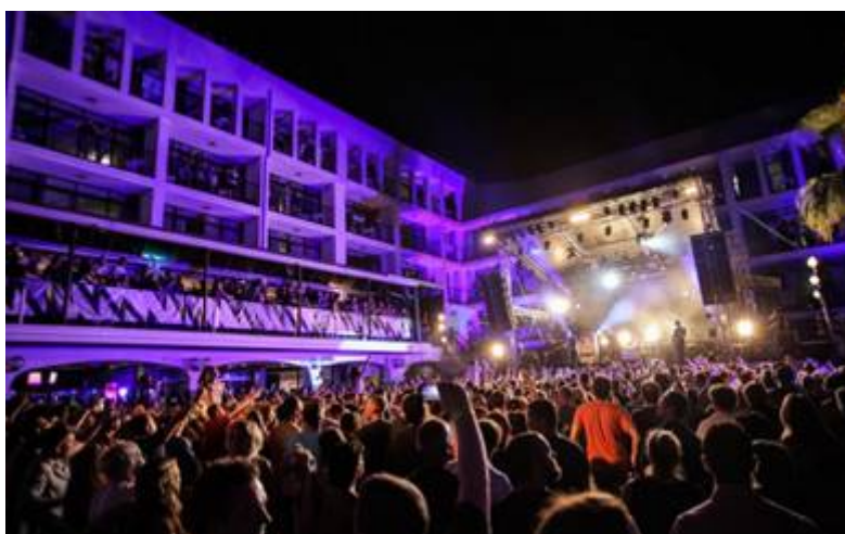
FIGURA 1 Fiesta en la zona de la piscina de Ibiza Rocks Hotel Web de Ibiza Rocks