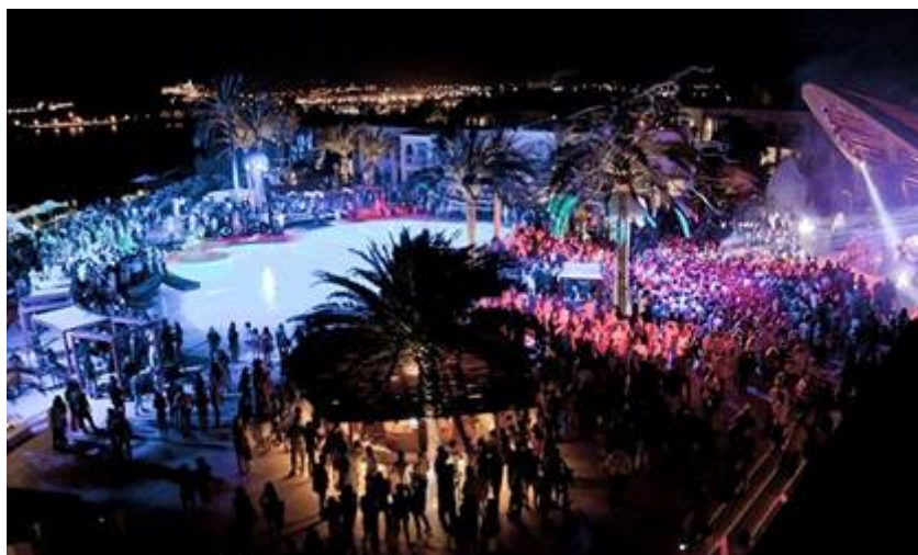
FIGURA 4 Destino Pacha Ibiza Resort