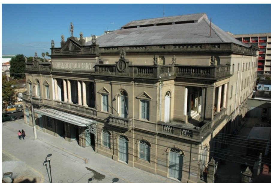
FIGURA 5 Teatro Guarany: fachada atual Prefeitura de Pelotas, 2013.

Assim, o Teatro Guarany vem passando por um processo de revitalização e, incluindo o turismo como uma forma de conservação desse patrimônio, contribuindo para o desenvolvimento da atividade turística em Pelotas. O Teatro, considerado um patrimônio, faz parte do Centro Histórico de Pelotas. Hoje, o Teatro pode e deve ser considerado com importante elemento da atividade turística em Pelotas.