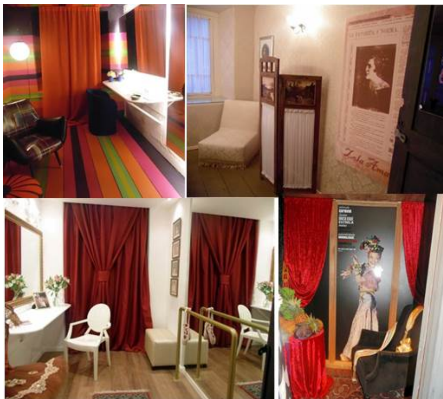
FIGURA 3 Camarins do Teatro Guarany após a reforma Espace Girl

Assim, aliar a valoração patrimonial com a prática turística representa uma ação inteligente, capaz de agregar valor na experiência turística, além de desenvolver na comunidade autóctone um maior senso de pertencimento, conseqüentemente, maior prazer na própria prática de prestação de serviço. Nessa perspectiva, tem-se percebido, nos últimos anos, um propalado interesse na prática do turismo cultural o que leva o patrimônio a converter-se em um importante recurso. Em 2009, a Universidade Federal de Pelotas começou a identificação das características do Teatro na época de sua fundação. Foram realizados pequenos descasques da tintura atual para verificar-se a pintura original. Esse mapeamento foi realizado com o objetivo de avaliar a possibilidade de um restauro no Teatro (Zero Hora, 2013 [abril 29], on line).