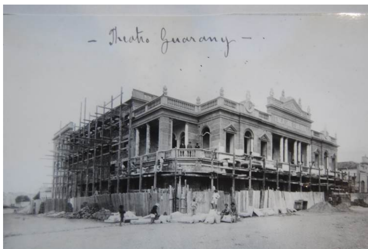
FIGURA 2 Teatro Guarany em construção (fachada) Acervo da Biblioteca Pública de Pelotas, 2015

Segundo Caldas et al. (1996), “a semana que antecedeu a inauguração do teatro provocou um alvoroço raramente visto na cidade” (p. 38). Só se falava sobre o Guarany e o interesse partia desde as classes mais abastadas até as menos favorecidas economicamente. Na Figura 2 é possível visualizar as obras do Teatro praticamente prontas.