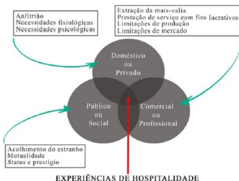
FIGURA 1 O Diagrama Venn dos domínios da hospitalidade Lashley (2015, p.81).

Para Lashley e Morrison (2004), as experiências concretas de hospitalidade, em qualquer contexto, apresentam-se como o resultado da influência de cada um dos domínios citados.