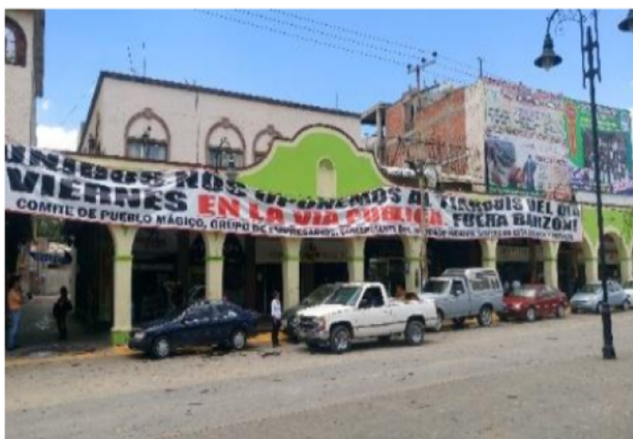
FOTOGRAFÍA 2 Manta en contra del Barzón 2 Trabajo de campo.

De esta forma, las entrevistas posibilitaron conocer que los actores realizan actividades de forma colectiva; asimismo, reconocen al turismo como un elemento que ha propiciado su colaboración de manera regular con otros actores, con el fin de obtener beneficios tanto en común como particulares.