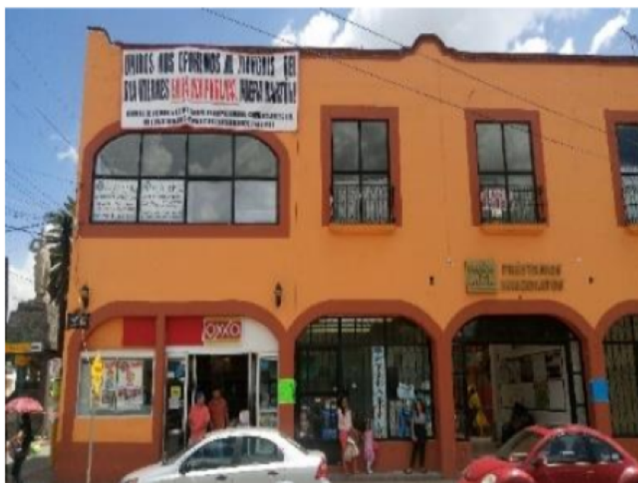
FOTOGRAFÍA 1 Manta en contra del Barzón 1 Trabajo de campo.