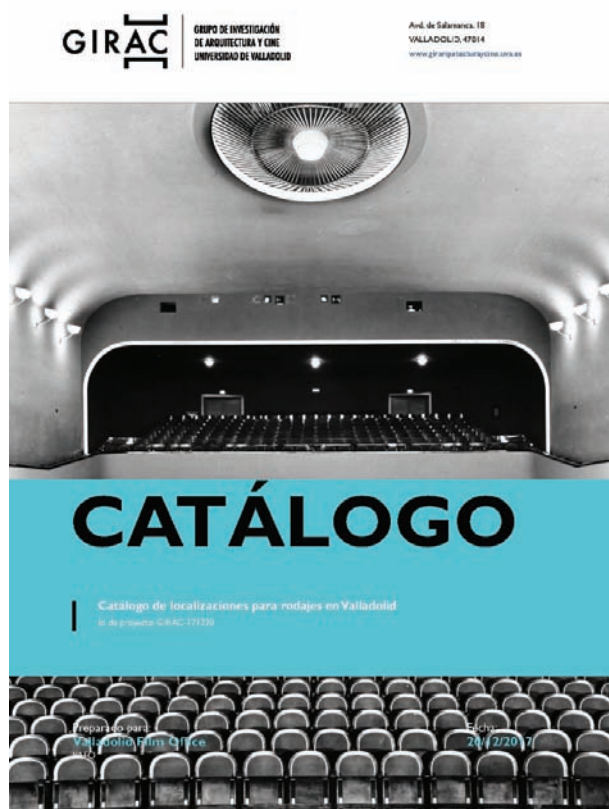
Figura 5 GIRAC, 2018. Catálogo “Arquitectura y Cine para Valladolid”. Valladolid: Ayuntamiento de Valladolid