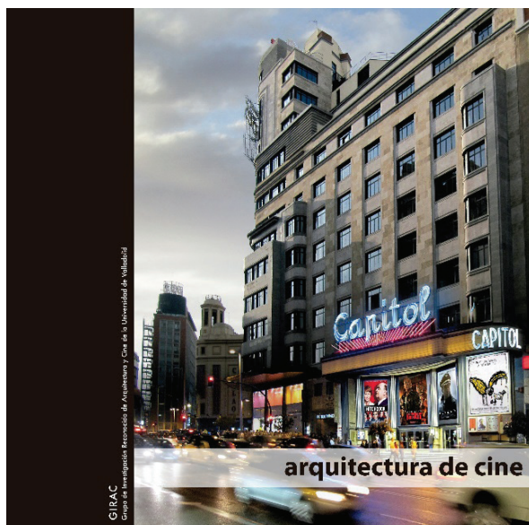
Figura 1 Portada del libro