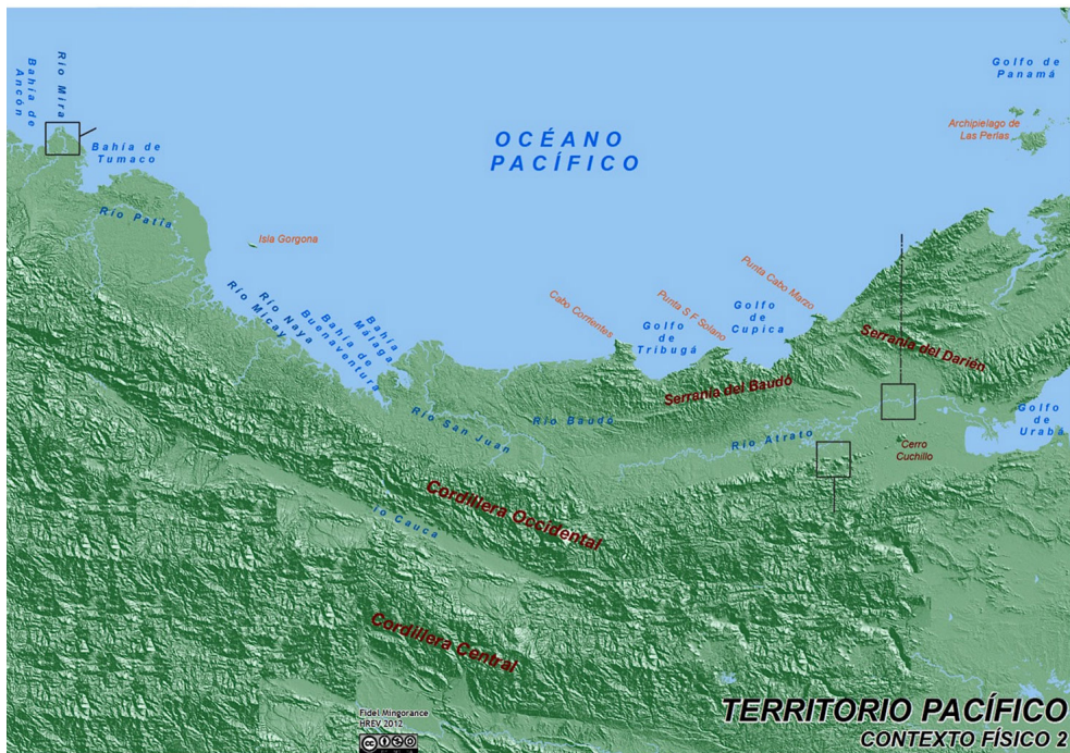
Figura 1. El callejón geográfico del San Juan-Atrato.

El General Londoño se refería así al río Atrato, que corre hacia el Atlántico, y al río San Juan, que corre hacia el Pacífico, así como al océano Pacífico y la cordillera Occidental, respectivamente. La delimitación del Chocó está dada por el océano Atlántico al norte, el océano Pacífico al occidente, la cordillera Occidental por el oriente, y el río San Juan y su delta por el sur (Figura 1).