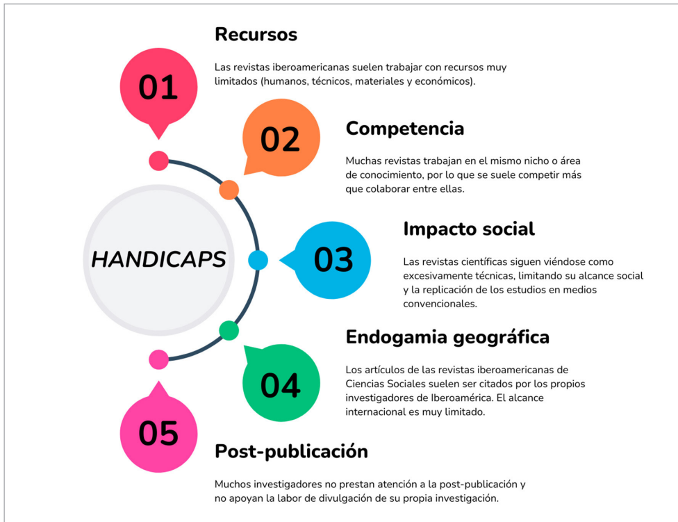
Figura 3. Principales hándicaps a resolver.