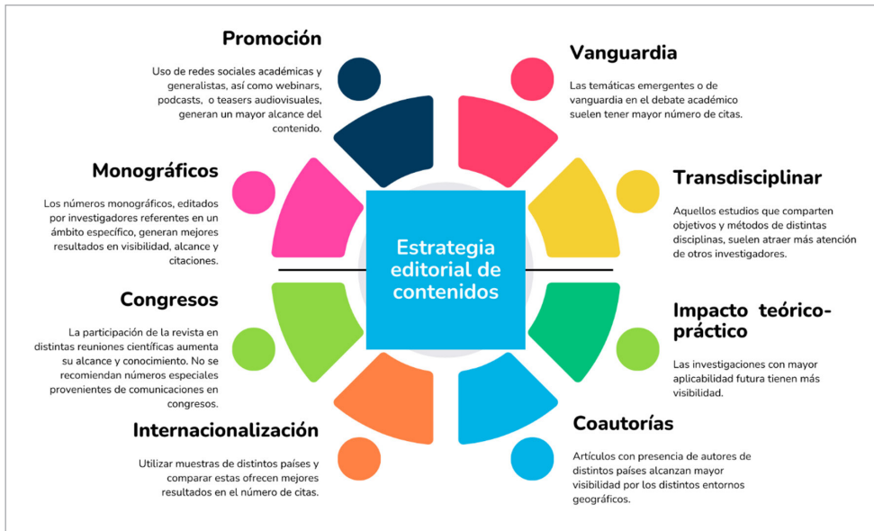
Figura 2. Estrategia editorial de contenidos.