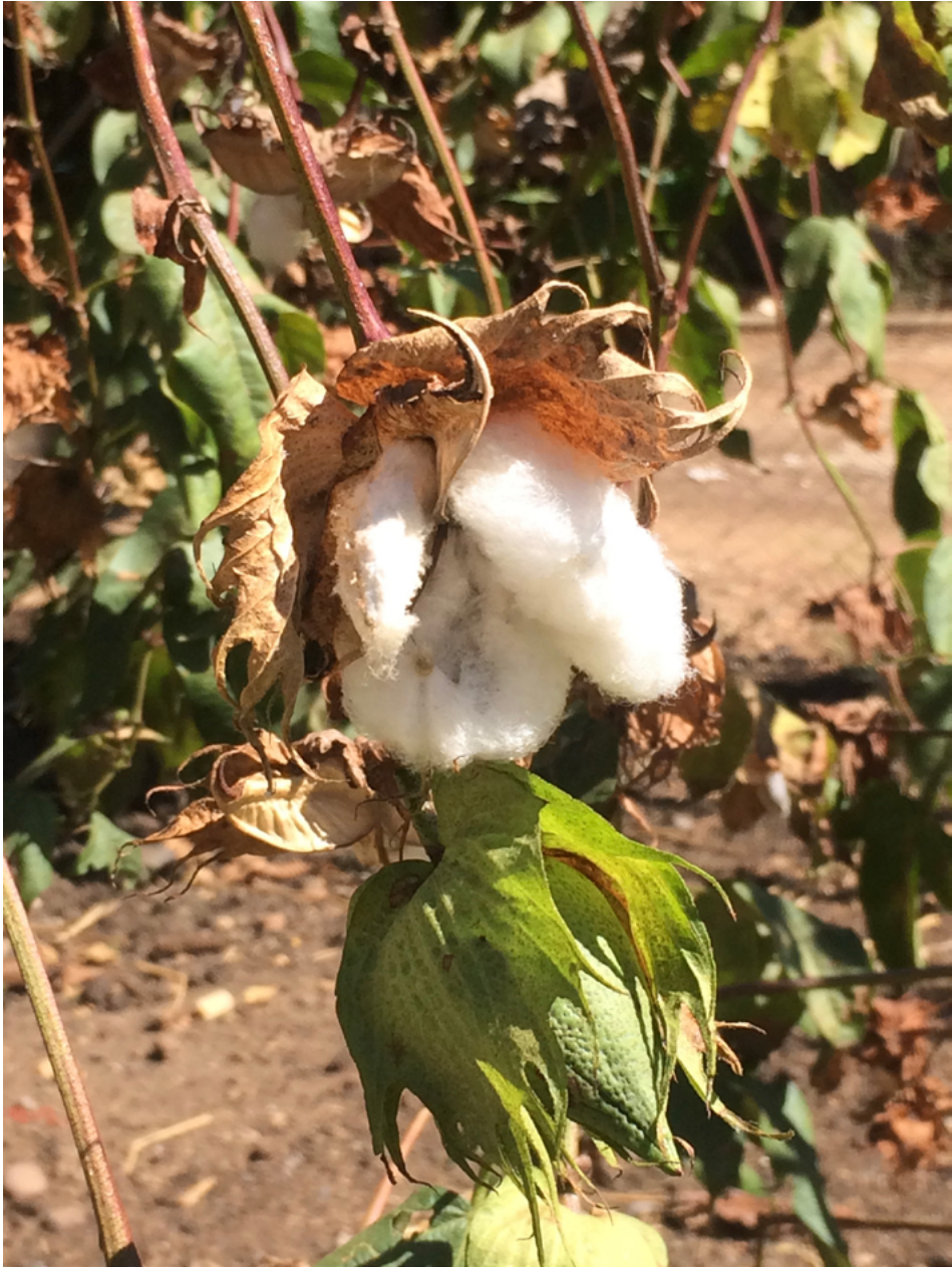
FIGURA 4 | Planta de algodón ( Gossypium hirsutum )