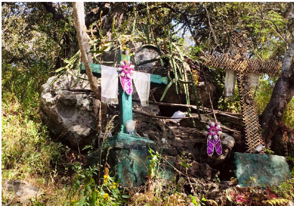
FIGURA 12 | La Ch’ul JMe’ Vixtik , ubicada en la ladera del sagrado cerro ( ch’ul vits ) San Bartolo

La Ch’ul JMe’ Vixtik no solo ayuda a las mujeres en su iniciación en el aprendizaje del tejido, sino también en el de la escritura, estableciendo una asociación en la comunidad entre ambas actividades. Según las tejedoras, esta ritualidad la practicaba, sobre todo, la gente de antes –incluyéndose a ellas mismas–, ya que consideran que en la actualidad las niñas ya no realizan esas ofrendas en la piedra.