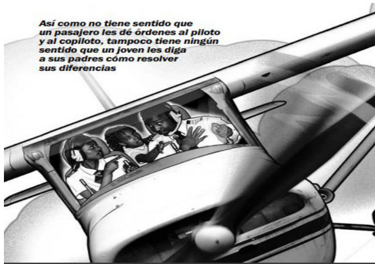
Ilustración 5.

(29) Los padres son como los socorristas de la playa: están en mejor posición que tú para ver los posibles peligros (WTBTSP, 2011, p. 269).