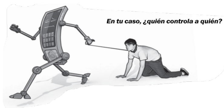
Ilustración 4.

(20) La pornografía te ata cada vez más: cuánto más la veas, más difícil te será dejarla (WTBTSP, 2008, p. 276).