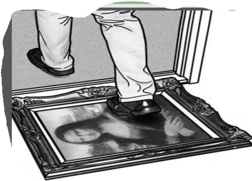
Ilustración 2.

El ejemplo más contundente de esta metáfora es el (14), que además se acompaña de la imagen referenciada en la Ilustración 2.