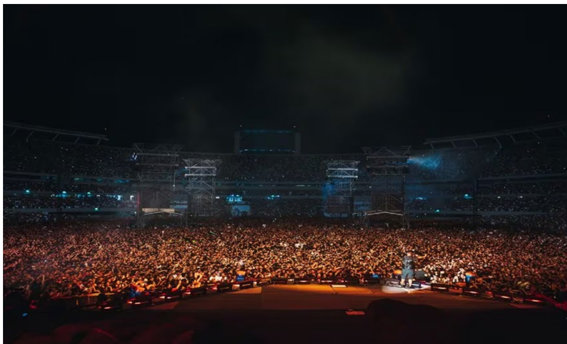
Imagen 1. Concierto de Duki en el estadio Monumental de River Plate (Argentina) ante 80.000 personas. Febrero de 2023.

un movimiento consolidado a partir de las figuras de Duki, Bizarrap, Wos, Trueno o Nicki Nicole, entre otros, liderando todos los rankings digitales de consumo musical e influyendo en el siempre controvertido paradigma identitario de una juventud que ya no quiere —ni puede— parecerse a la de antes.