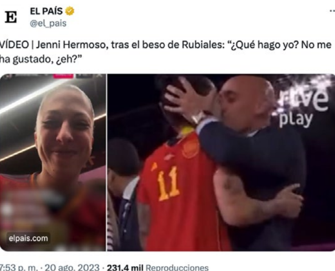
Imagen 2. Detalle del hipervínculo visual utilizado por El País en la red social X. (Fuente: https://elpais.com/deportes/mundial-futbol-femenino/2023-08-20/video-jenni-hermoso-tras-el-beso-de-rubiales-que-hago-yo-no-me-ha-gustado-eh.html?ssm=TW_CM )