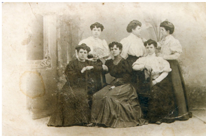
Foto de estudio de señoras residentes en Simat en 1892

Fuente: Fotografía tomada por la autora de la Colección Local Biblioteca Pública de Simat.