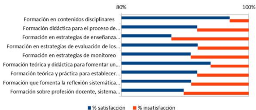
Figura 1 Satisfacción con la formación inicial de profesores. Elaboración propia

En síntesis, la satisfacción más alta se encuentra en la formación en contenidos disciplinares y la formación teórica y didáctica para fomentar un clima apropiado en el aula. Los aspectos que consiguen menor satisfacción son la formación en estrategias de enseñanza significativas para los estudiantes y la información actualizada sobre sistema escolar y políticas educativas. En total, un 91% de los encuestados se manifiesta satisfecho con la formación inicial docente. El siguiente gráfico sintetiza los resultados.