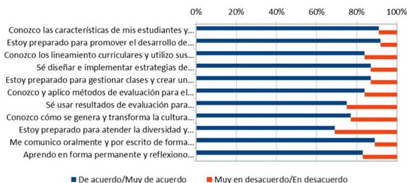
Figura 2 Acuerdo y desacuerdo con la formación recibida según Estándares Orientadores Elaboración propia

Finalmente, la afirmación aprenden en forma permanente y reflexionan sobre su práctica docente alcanza un promedio de 3.1. En efecto, ocho de cada diez encuestados evalúan positivamente el ítem: un 50% se declara de acuerdo, mientras un 33% indica estar muy de acuerdo. Estos resultados se resumen a continuación.