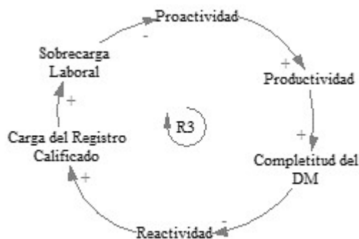
Figura 3 Ciclo de balance entre proactividad, sobrecarga laboral y carga registro calificado Ciclo de balance entre proactividad, sobrecarga laboral y carga registro calificado elaboración propia.

En la figura 3 se observa el ciclo de refuerzo de la proactividad R3, que describe la relación de la completitud del documento maestro y la influencia de variables de reactividad y proactividad de los actores. Este muestra cómo la proactividad afecta la completitud del documento a la vez que ejerce una reactividad por parte de los actores e induce a una sobrecarga laboral.