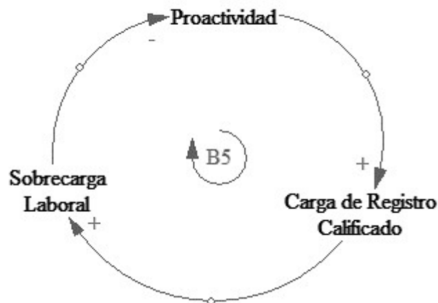
Figura 2 Ciclo de balance entre proactividad, sobrecarga laboral y carga registro calificado. Ciclo de balance entre proactividad, sobrecarga laboral y carga registro calificado. elaboración propia.

En la figura 3 se observa el ciclo de refuerzo de la proactividad R3, que describe la relación de la completitud del documento maestro y la influencia de variables de reactividad y proactividad de los actores. Este muestra cómo la proactividad afecta la completitud del documento a la vez que ejerce una reactividad por parte de los actores e induce a una sobrecarga laboral.