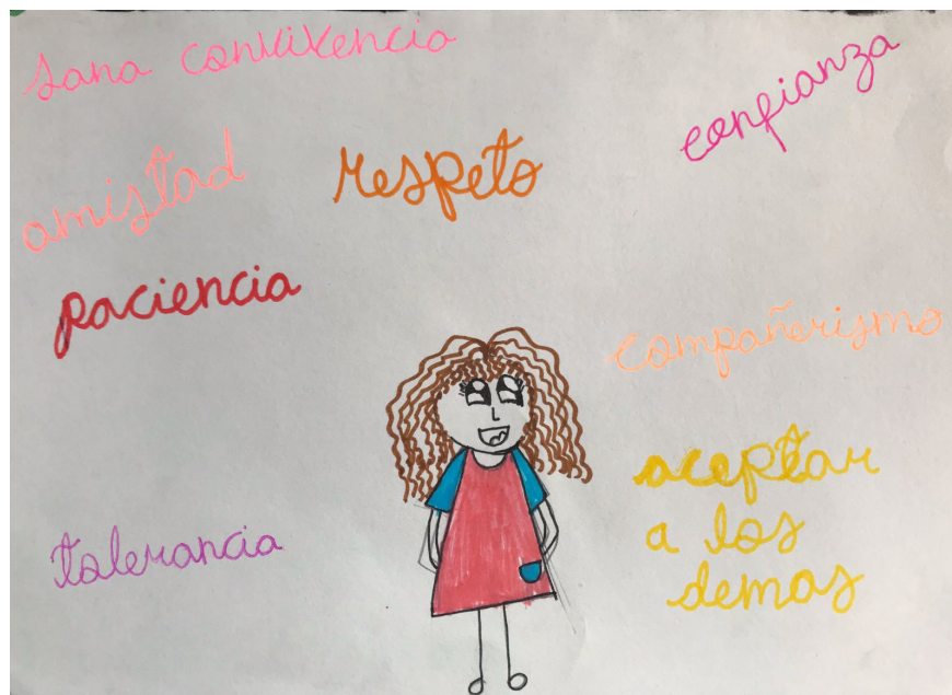
Figura 3. El después, dibujo elaborado por la estudiante 1

Por otra parte, la Figura 3 muestra el después de los dibujos, en el caso particular de la estudiante 1, quien representó formas y expresiones positivas en cuanto al color y al significado de las palabras que lo acompañan. En este sentido, en diálogo abierto con los participantes, la estudiante 1 comentó sobre la realización de este dibujo, ella comentaba con sus compañeros que muchos aspectos habían cambiado en la Institución Educativa, aclaraba que ahora sí podía hablar, “¡Esta vez, mis churcos van a quedar más lindos!”.