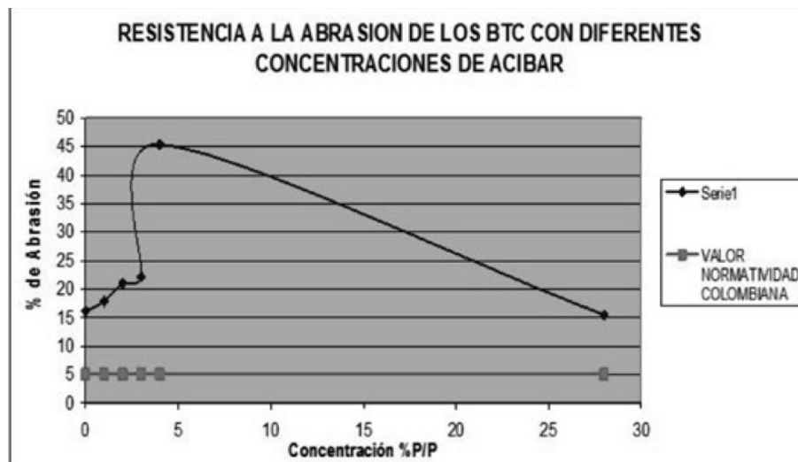
Gráfica 2 Coeficiente de resistencia a la abrasión de diferentes concentraciones de Acibar de Sábila. Elaborado por los investigadores (2010).