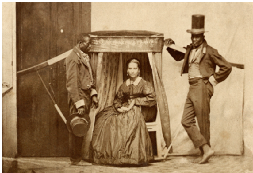
Fig. 7. Anónimo. "Señora en la litera con dos esclavos", 1860. Colección Gilberto Ferrez, Acervo Instituto Moreira Salles.

En todas esas fotografías se manifiesta el drama del cautiverio, los maltratos físicos y los abusos cometidos contra los esclavos en Brasil, sometidos al yugo de los blancos. Sin duda, estas representaciones visuales dialogan con los episodios violentos de la novela de Manso y comparten, además, un cierto propósito didáctico dirigido a los espectadores y al público. En conjunto, dichas imágenes —visuales y literarias— contribuyeron a difundir un imaginario poderoso sobre la violencia racial y el colonialismo en América durante el siglo XIX. Son representaciones difíciles de olvidar, que documentan la dominación de los blancos sobre las razas oprimidas en el marco de un imperialismo persistente en la región.