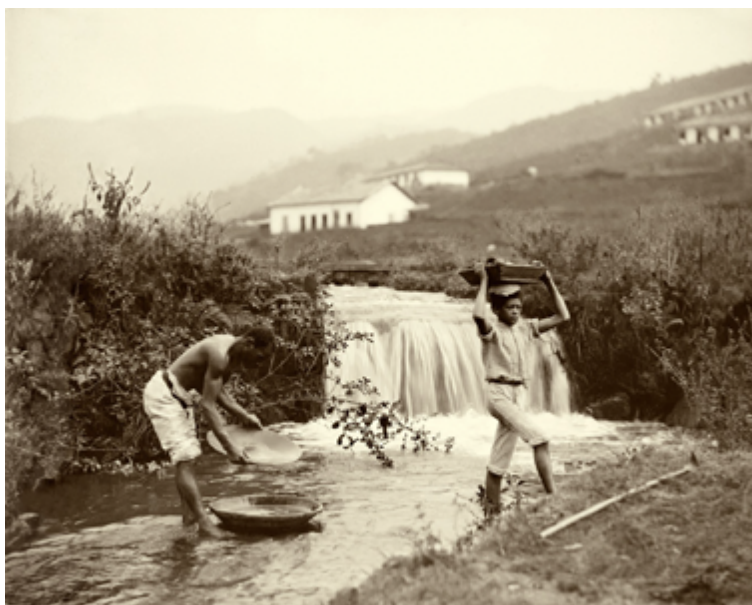
Fig. 6. Ferrez, Marc. "Lavado de oro", 1880. Colección Gilberto Ferrez, Acervo Instituto Moreira Salles.