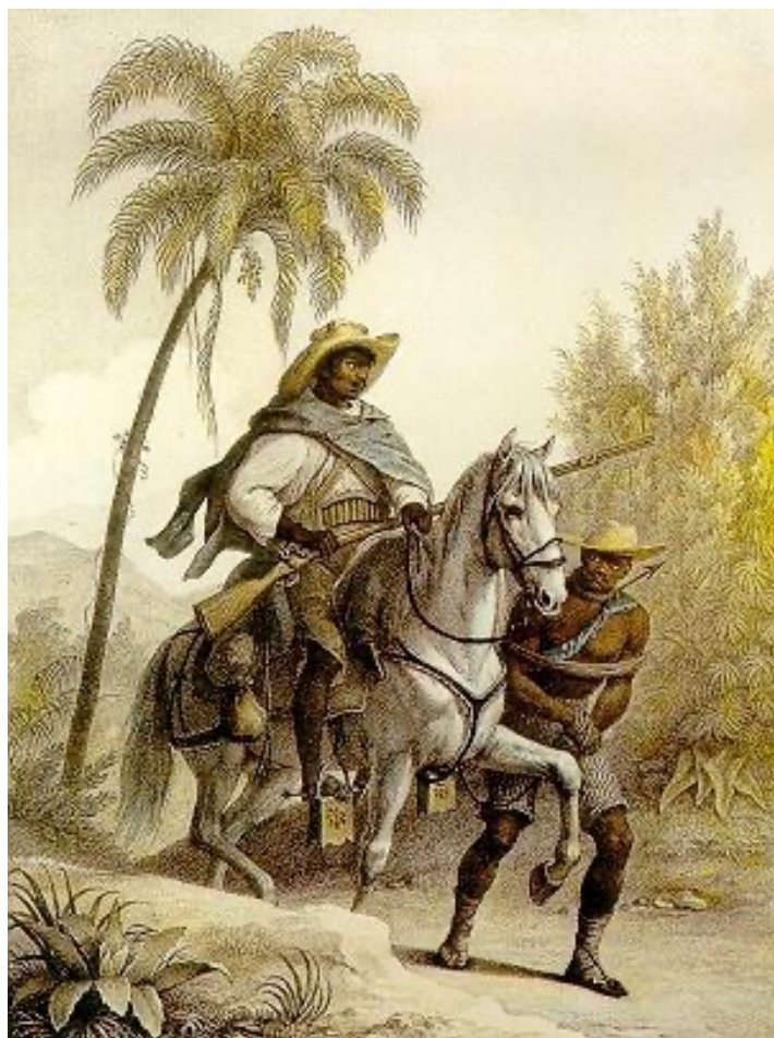
Fig. 4. Rugendas, Maurice. “El cazador de recompensas buscando esclavos fugitivos”. Enciclopédia Itaú Cultural de Arte e Cultura Brasileira . Itaú Cultural, 2025, https://commons.wikimedia.org/wiki/Johann_Moritz_Rugendas#/media/File:Capitao-mato.jpg .

Desde luego, existe un vasto repertorio visual sobre la temática de la esclavitud en Brasil, que no se limita a la pintura, sino que incluye también fotografías de época, muchas de ellas hoy fácilmente accesibles en la web. Destaco algunas que fueron curadas para una exposición realizada en el Museo de Arte Contemporáneo de São Paulo, donde se reunieron 74 imágenes sobre el tema. Entre ellas: Salida para la cosecha de café en carreta (tomada en el Valle del Paraíba, en 1885); Lavado de oro (realizada en Minas Gerais, en 1880); y Señora en la litera con dos esclavos (tomada en Bahía, en 1860, por autor no identificado).