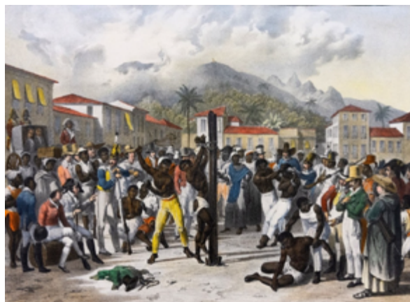
Fig. 3. Rugendas, Maurice. “Castigo público”. Enciclopédia Itaú Cultural de Arte e Cultura Brasileira . Itaú Cultural, 2025, https://commons.wikimedia.org/wiki/File:Johann_Moritz_Rugendas_in_Brazil_2.jpg .

No hay constancia de que Juana Manso haya tratado personalmente al artista durante su estancia en Río de Janeiro, pero es casi seguro que conoció sus obras, así como las de Jean-Baptiste Debret —quien vivió allí entre 1816 y 1831—. En 1845, Manso residía en Río; al año siguiente viajó con su esposo a los Estados Unidos y luego a La Habana. Tenía entonces veintisiete años. Regresó en 1847 y permaneció en la ciudad carioca hasta 1854, año en que volvió definitivamente a su patria.