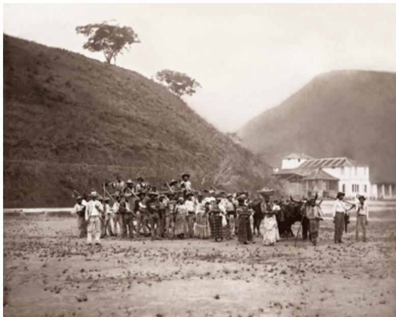
Fig. 5. Ferrez, Marc. "Salida para la cosecha de café en carreta", 1885. Colección Gilberto Ferrez, Acervo Instituto Moreira Salles.