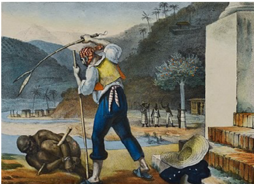
Fig. 1. Debret, Jean Baptiste. "Overseers punishing slaves on a rural estate". The Destruction of Brazilian Slavery 1850-1888 , University of California Press, Ltd, 1972, https://commons.wikimedia.org/wiki/Jean-Baptiste_Debret#/media/File:Pelourinho.jpg