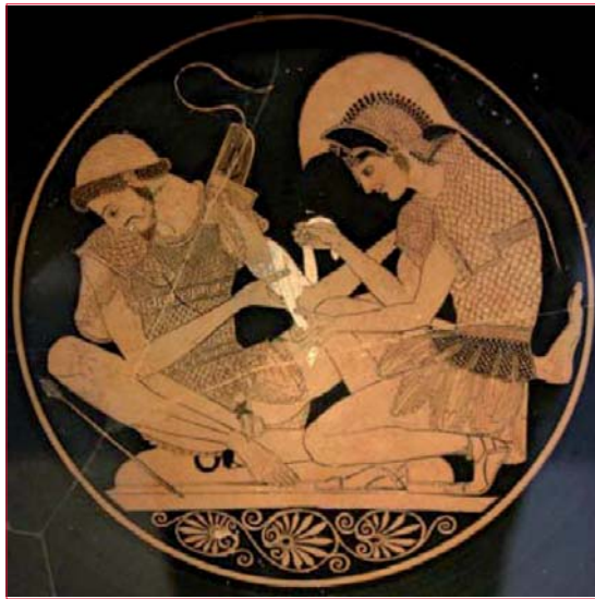
Figura 1. Tekné y medeos: cerámica griega que muestra a Aquiles curando una herida de Patroclo y proporcionándole cuidado.

el cual, a través de la exposición racional de los discursos, se llega a lo verdadero. Este viaje a la etimología de la palabra diálogo tiene una implicancia práctica ineludible: quiere decir que el origen de la palabra parece validar la interpretación moderna de la relación médico-paciente como un proceso comunicacional y decisorio esencialmente colaborativo, negociado y dialógico.