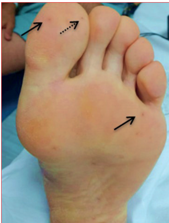
Figura 1. Se observan lesiones maculares purpúricas (flechas continuas) así como una lesión petequial (flecha punteada) a nivel del primer dedo.

menes de laboratorio, se destacaba una leucocitosis de 14.700/ \mu l a predominio neutrofílico, una VES de 82 mm y una PCR de 69 mg/dl. Los dos hemocultivos extraídos al ingreso desarrollaron colonias de Staphylococcus aureus meticilino sensible.