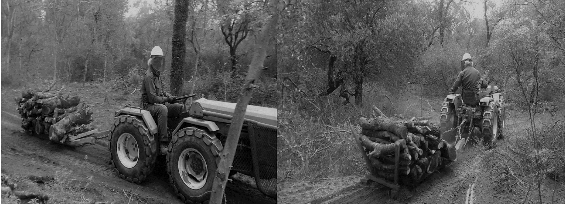
Figura 3. Equipo utilizado durante actividad de extracción primaria (tractor adaptado con trineo).

El transporte primario fue realizado por 5 operarios en total, de los cuales dos operarios se encontraban en cada punto de carga, dos operarios en cada zona de descarga y el operador del tractor quién colaboró en la acción de enganche y desenganche del trineo.