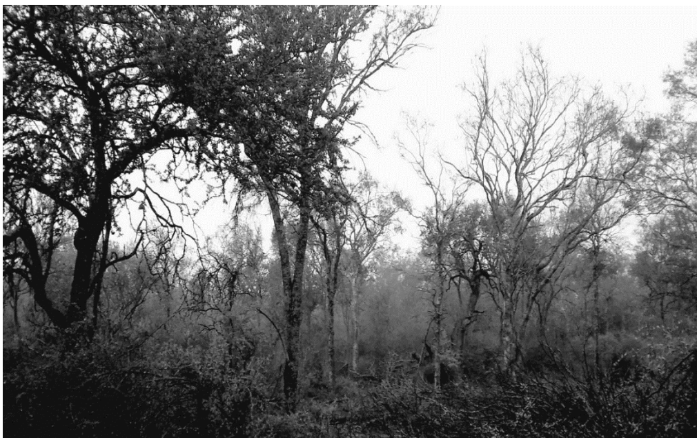
Figura 2. Fisonomía del bosque en el área de estudio.

La vegetación está representada por las unidades fisonómicas características del Chaco Semiárido: bosque, parque, arbustal y pastizal. Los bosques presentan una matriz de cobertura arbórea de 12 m a 18 m, con un estrato arbustivo inferior de hasta 3 m a 4 m de altura total. Las especies arbóreas dominantes son Aspidosperma quebracho-blanco Schltl. (quebracho blanco) y Schinopsis quebracho colorado Schltl. (quebracho colorado), mientras que entre los arbustos se destacan por su dominancia Acacia furcatispina Burkart. (teatín), Celtis pallida Toor. (tala) y Capparis atamisquea Kuntze. (atamisqui) (Equipo forestal de la Estación Experimental Agropecuaria INTA Santiago del Estero, 2012).