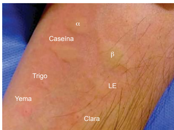
Figura 1. Resultados de la prueba cutánea a alimentos en un paciente adulto con anafilaxia por contacto con leche. Alérgenos IPI ASAC glicerizados diluidos 1:100 en solución glicerizada, la cual fue usada como control negativo. \alpha = reactivo para \alpha -lactoalbúmina, \beta = reactivo para \beta -lactoglobulina, LE = leche entera diluida 1:100 con agua destilada utilizada en prueba por punción cutánea. Los demás los alérgenos no se diluyeron.

Aunque la vía más frecuente de exposición es el tracto gastrointestinal, existen algunos reportes de síntomas severos de alergia alimentaria y anafilaxia inducidos por contacto o inhalación del alérgeno en niños, 3,4,5 pero no hay reportes en adultos. Una encuesta enviada por internet a padres de 51 niños que experimentaron anafilaxia exploró las circunstancias relacionadas con el evento: 16 % indicó anafilaxia posterior al contacto con el alérgeno y 5.9 %, después de inhalar el alérgeno responsable. 7