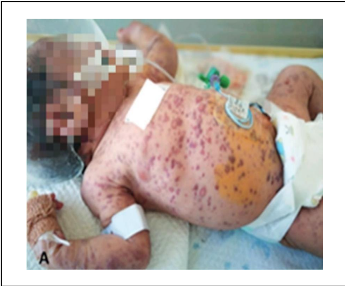
Figura 3. Dermatitis diseminada, caracterizada por máculas eritematosas, mal delimitadas e irregulares, con pápulas eritematosas de bordes regulares bien definidos (Imagen autorizada para su publicación por parte de la Dra. Natalia del Carmen Negroe Ocampo, Oncóloga pediatra).

bordes regulares bien definidos y prurito ( Figura 3 ); cuadro compatible con EICH estadio 2, grado I, por lo que se inició tratamiento con tocilizumab 12 mg/kg, metilprednisolona 2 mg/kg/día, tacrolimus por vía tópica cada 8 horas, antibióticos betalactámicos y aminoglucósidos. De manera simultánea se sospechó EICH hepática, debido a la elevación de las concentraciones de alanina aminotransferasa (567 U/L) y aspartato aminotransferasa (398 U/L). Dos días después tuvo convulsiones tónico-clónicas generalizadas, por lo que recibió dos dosis de midazolam 0.3 mg/kg, además de depresión respiratoria luego del segundo rescate, que requirió tratamiento avanzado de la vía aérea, con lo que manifestó una tercera convulsión, requiriendo impregnación con levetiracetam 60 mg/kg.