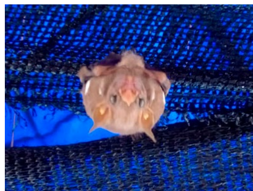
Figura 3. Registro fotográfico del murciélago Ametrida centurio en el municipio de Santiago de Tolú, departamento de Sucre, Colombia.