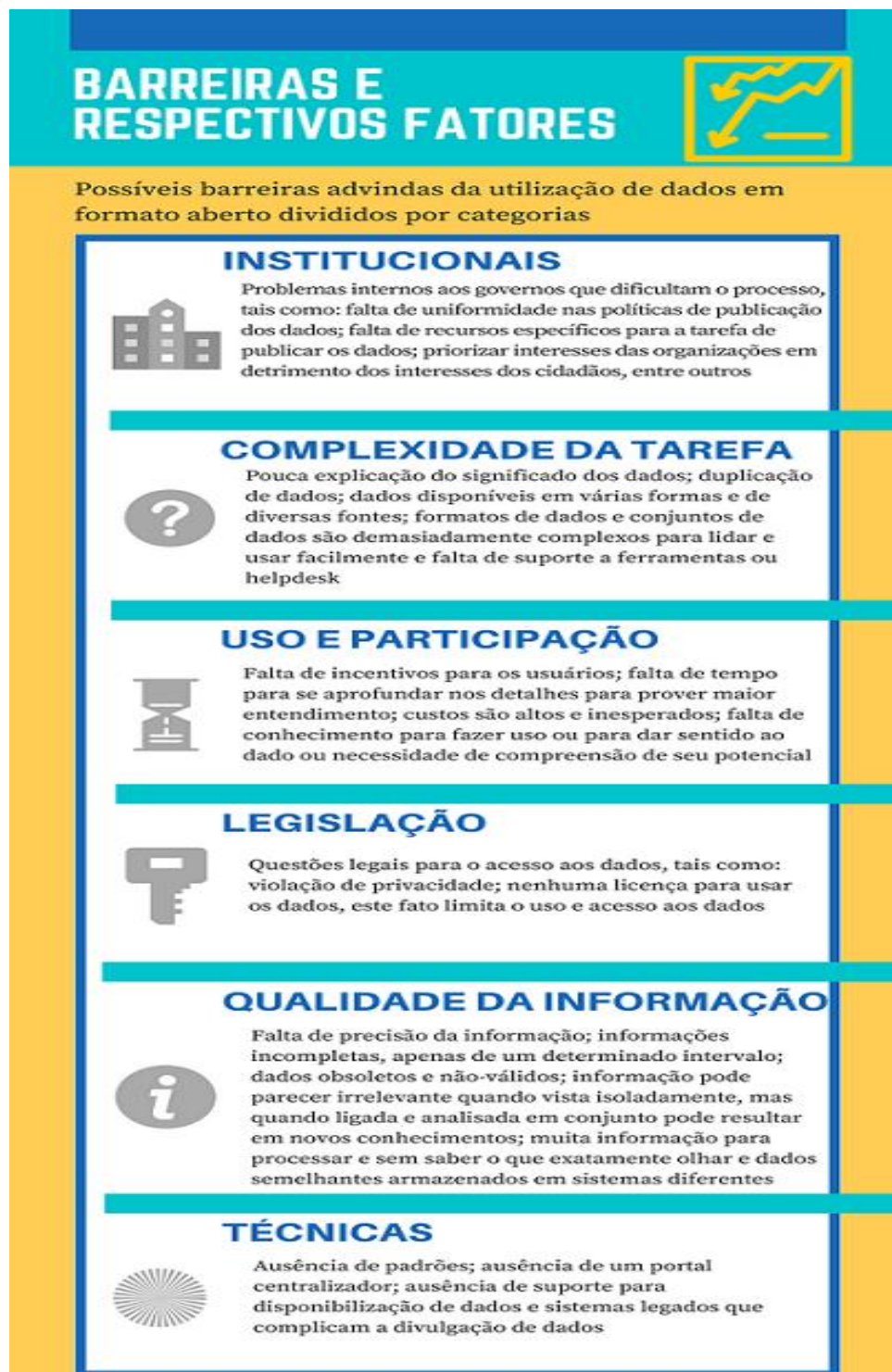
Figura 2 – Possíveis Barreiras.