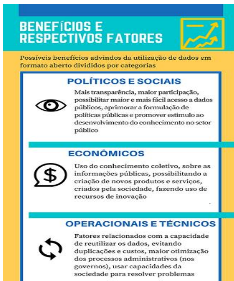
Figura 1 – Possíveis Benefícios.