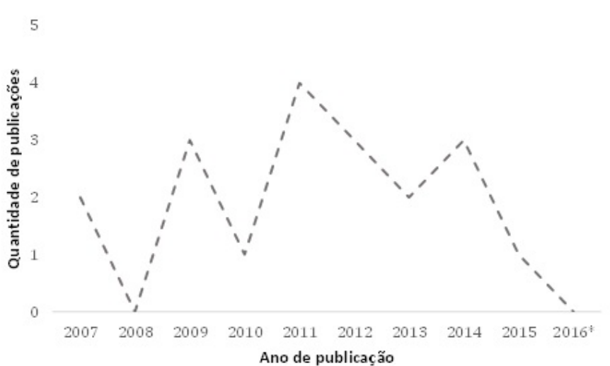
FIGURA 2. Evolução e Distribuição das publicações da amostra ao longo do período de seleção, 2007 a 2016 (*até março de 2016). Uberaba/MG, 2016.

entanto, há algumas quedas nesta tendência, não havendo publicações em 2008 e somente uma em 2010 20 . Em 2007 21,22 há duas publicações, e em 2009 23,24,25 três artigos. No período de 2012 a 2016 verifica-se uma tendência decrescente de publicações, sendo três em 2012 26,27,28 e 2014 29,30,31 , duas em 2013 32,33 , e uma em 2015 34 , não havendo publicações até março de 2016 (Figura 2).