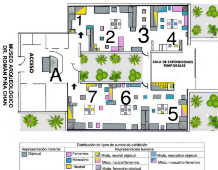
Figura 4. Distribución de tipos de puntos de exhibición Elaboración propia.

La colección se presenta en 102 puntos de exhibición: 35 vitrinas con conjuntos de piezas relacionadas significativamente funcional o culturalmente; 63 bases con o sin capelos muestran piezas en solitario, o máximo cinco dependiendo de su tamaño, para enfatizar su contenido en el discurso visual museográfico; tres ambientaciones, dos entierros prehispánicos y restos de paleofauna, y un conjunto de fotografías.