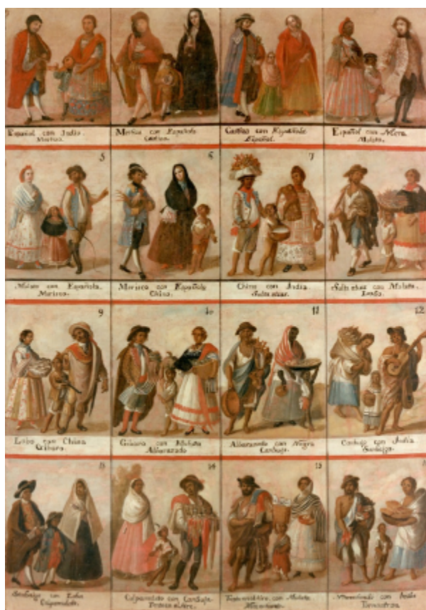
Figura 1. Cuadros de castas Anónimo (Siglo XVIII)