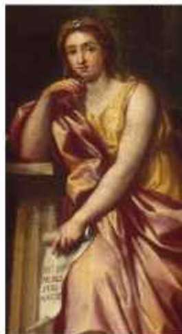
Figura 14 Mengs, Anton. Parnaso . 1761 (aprox). Óleo sobre tabla. Museo Hermitage