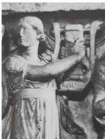
Figura 9 Euterpe . Sarcófago romano frente, s. II d. C.

Fuente: Kunsthistorisches Museum. (Autor desconocido)