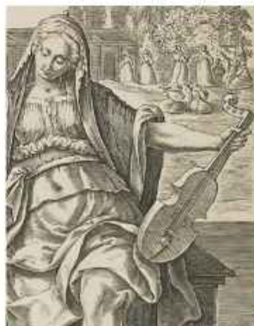
Figura 10 Terpsícore . s. XVI. Grabado en papel. National Galleries Scotland

Cambiando de objeto, la pluma y la lira (ver figura 4) han sido concebidas como representativas de Terpsícore, a quien Murray (2020) define desde el “dance-delight” porque las palabras choroi y chorus describen la danza (p. 16). La pluma se explica a partir de la relación con el libro, un elemento que, según Walter Salmen (1998), entró en la Edad Media debido a la personificación del concepto de “iudicare” (juzgar), vinculado a “iudicare quot in venians” (p. 81) (juzgar lo que encuentras): “As a result, we find pictures of Terpsichore either reading a book [...], holding a scroll, or writing on a board” (p. 81).