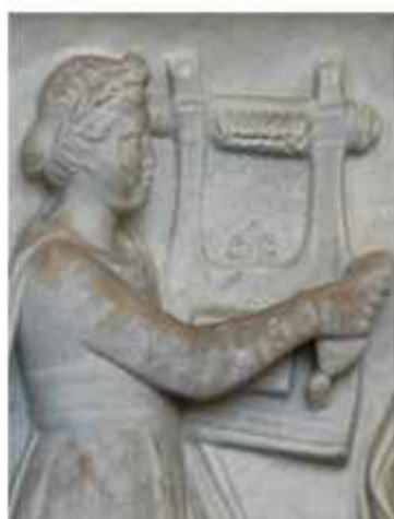
Figura 7. Muses Sarcophagus (Érato). S. II d. C. (aprox). Relieve en mármol