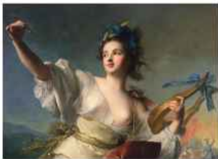
Figura 11. Terpsícore . 1739. Óleo sobre lienzo. Palacio de la Legión de Honor