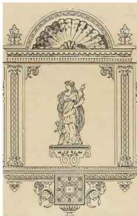
Figura 2. Portada