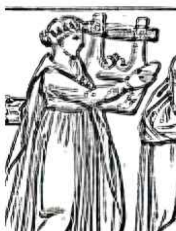
Figura 8. Érato. 1888. Grabado