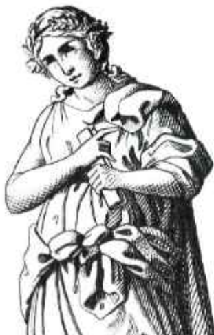
Figura 13. Calliope . 1851. Iconographic Encyclopedia Of Science Literature And Art