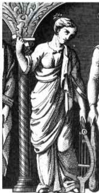
Figura 12. Érato . 1851. Grabado. Iconographic Encyclopedia of Science Literature and Art