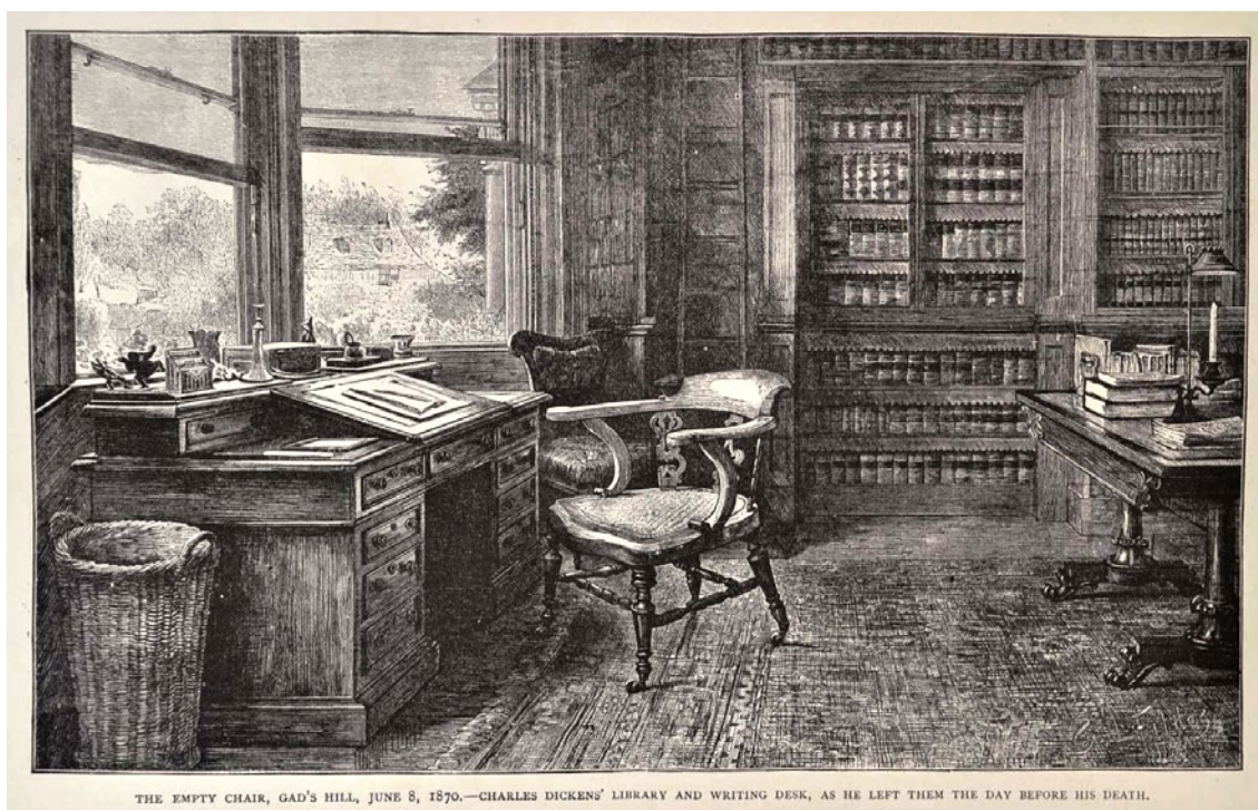
Figura 1. Xilografía realizada por The Graphic que reproduce The Empty Chair , acuarela s/papel de Sir Samuel Luke Fildes, 1870.

Vincent Van Gogh se refiere, en algunas cartas del período final de su vida, a una xilografía del estudio de Charles Dickens titulada Empty chair , realizada en 1870 por Luke Fildes luego de la muerte del escritor inglés (ver figura 1). Allí pueden verse los objetos corrientes de cierto tipo de escritor: papeles sobre el escritorio, libros, velas, pocillos, un basurero, una biblioteca, su escalera para libros, un sofá, un escritorio auxiliar y una silla comfortable.