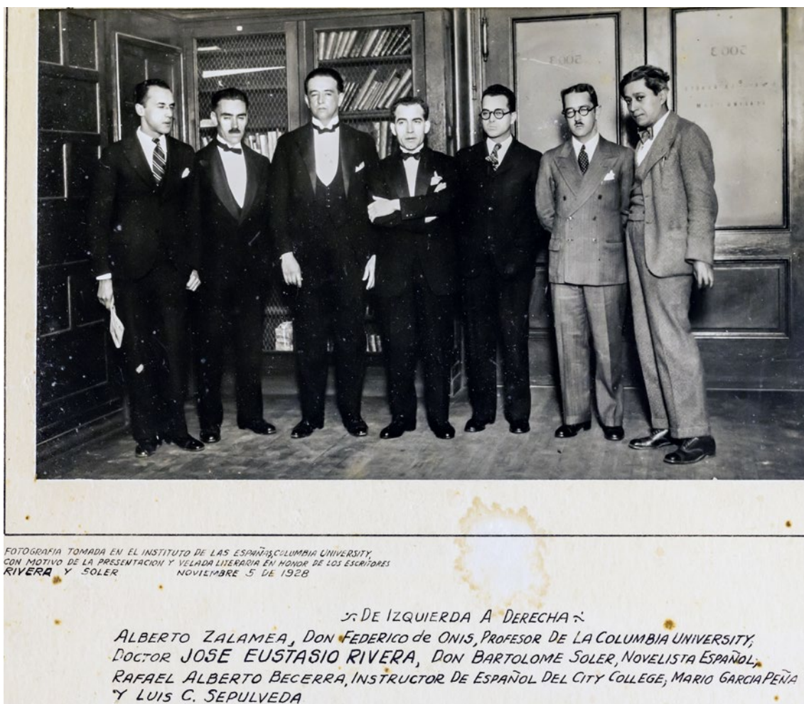
Figura 9. Fotografía con leyenda explicativa de Velasco.

Rivera encontró en el viaje de Méndez una oportunidad para enviar algunos ejemplares de la quinta edición de La Vorágine , que partieron con el aviador en días posteriores. Quizás sea irrelevante, pero al ser ese vuelo el primero Nueva York-Bogotá los ejemplares de La Vorágine que viajaron fueron los primeros libros que llegaron volando a la capital colombiana: