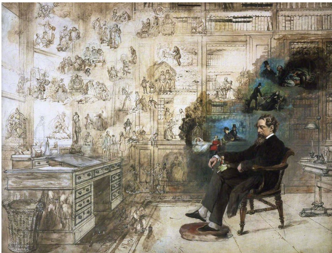
Figura 2. Robert Buss, Dickens' Dreams , acuarela (inconclusa), 90,5 x 11 cm, 1875. Charles Dickens Museum, Londres.

El grabado de Fildes fue una referencia central para el proyecto de Van Gogh de la Casa Amarilla en Arles, en el Midi francés. En sus cartas hay detalles de cómo la amobló pensando en la visita de Paul Gauguin, quien iría en octubre del año 1888 (Van Gogh, 1997). Como se sabe, tras una disputa, Van Gogh lo amenazó con una navaja de barbero. Gauguin abandonó la casa y el pintor de los girasoles se cortó el lóbulo de una de sus orejas.