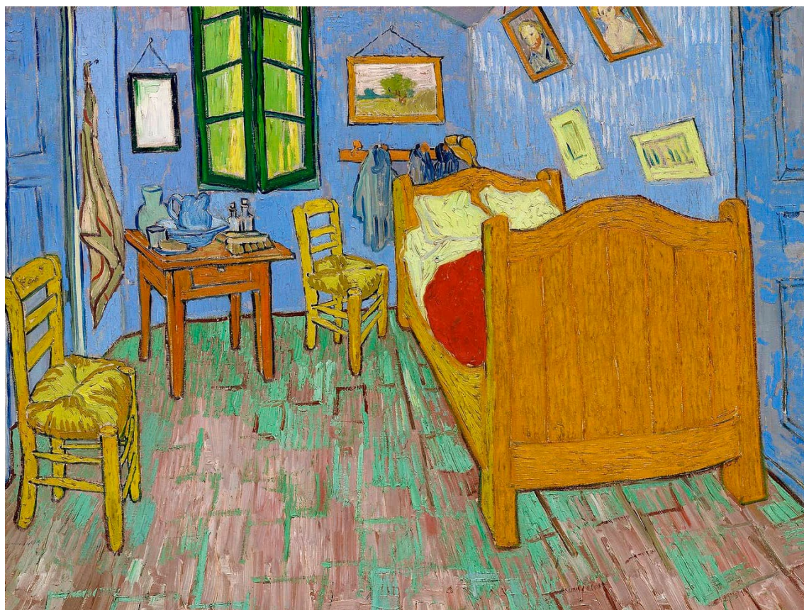
Figura 5. Vincent Van Gogh, El dormitorio en Arlés (segunda versión), óleo s/lienzo, 72 x 90 cm, 1889, Art Institute de Chicago.

La reflexión sobre el estudio del escritor no forma parte central de la investigación literaria, como sí ocurre con el estudio del pintor o del artista. 1 Una excepción son los ensayos Great Men's Houses (1911) y A room of one's own (1929) de Virginia Woolf, que han inspirado proyectos de colaboración entre fotógrafos y escritores (Battershill, 2014), o crónicas como Rooms of their own. Where Greats Writers Write (2022) de Alex Johnson.