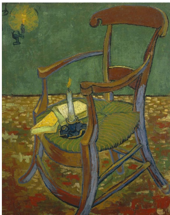
Figura 3 y 4. A la izquierda, La silla de Van Gogh y su pipa (Vincent's stool met zijn pijp), óleo s/lienzo, 91.8 x 73 cm, 1888, National Gallery, Londres; a la derecha, La silla de Gauguin (Paul Gauguin stool), óleo s/lienzo, 90,3 x 72,5 cm, 1888, Museo Van Gogh, Amsterdam.

Estas menciones parecerían no tener relación con la obra del escritor colombiano José Eustasio Rivera (1888-1928), pues ¿no están la selva del Amazonas, o los conocidos y múltiples viajes de Rivera, lejos de la imagen de lo que parecería ser más un artista de escritorio y un escritor de estudio? Sin embargo, parte de su archivo, no solo está conformado por listas de bienes y objetos personales, sino que uno de esos objetos es la silla de su estudio en la Editorial Andes (ver figuras 6 y 10).