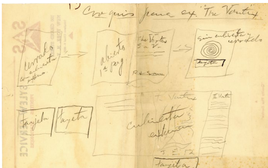
Figura 14. Croquis de la exposición The Vortex .

A partir de esta actividad nostálgica de coleccionista, Velasco reunió objetos y recuerdos de Rivera y se conectó, indirectamente, con una tradición expositiva de las cosas de los grandes escritores que, en general, ha tomado prestado sus lenguajes de la pintura, la fotografía y la transformación cuasi-escultórica de objetos que, inicialmente, o formaban parte de la esfera privada del escritor, como es el caso del museo de Dickens (ver figura 1), o extraen microescenas de sus obras de ficción para acompañar la observación de la obra del escritor, como lo había imaginado Buss (ver figura 2).