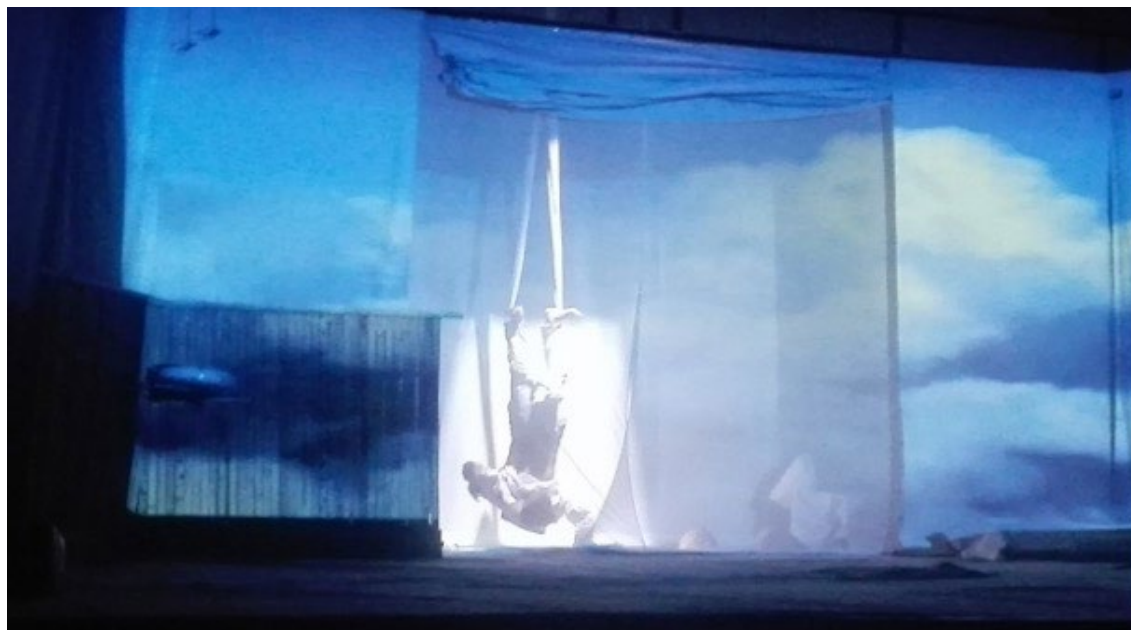
Figura 1. Donde se descomponen las colas de los burros