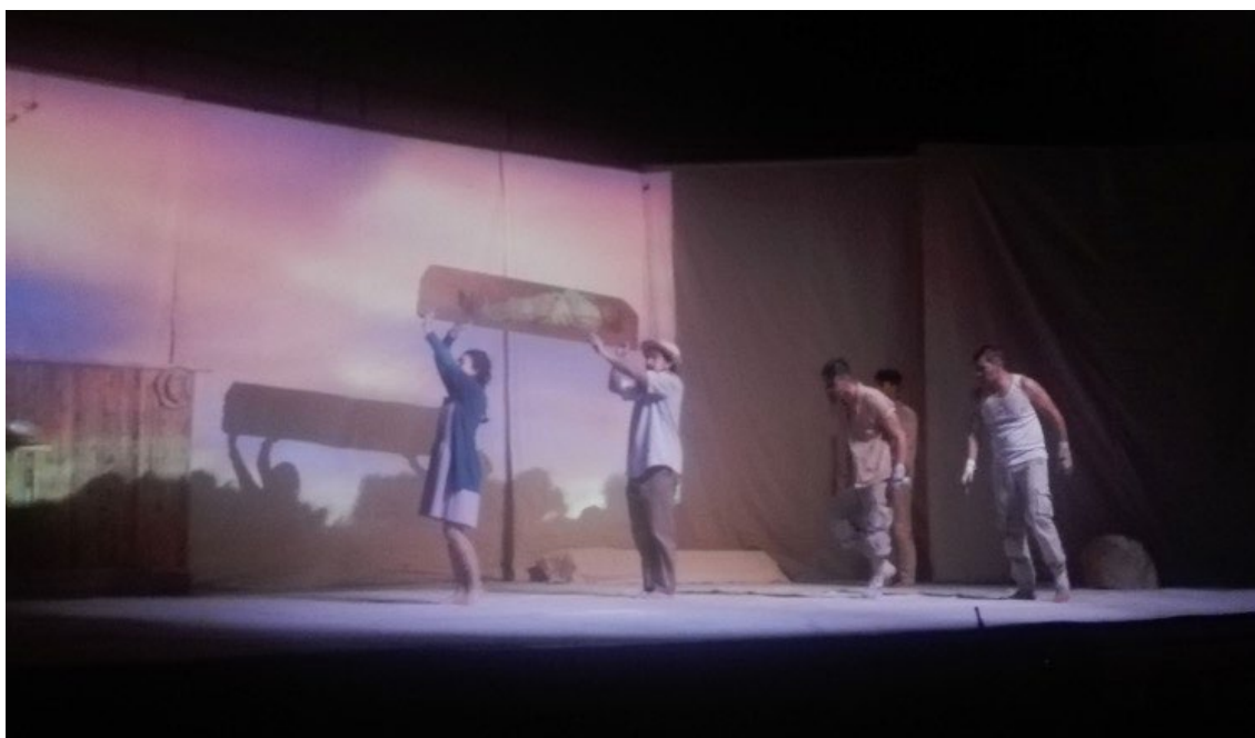
Figura 2. Donde se descomponen las colas de los burros