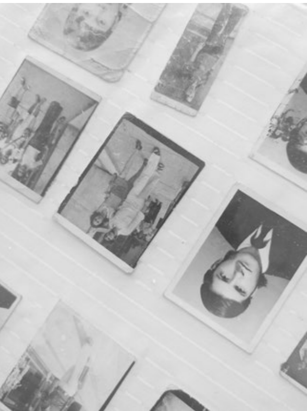
Álbum de familia. El álbum fotográfico constituye la éfrasis sobre la que se construye la novela El día de la mudanza de Pedro Badrán.

modo, se trasciende la noción tradicional de los acercamientos críticos obsesionados con establecer la “intención” originaria del autor, y más bien se interroga a la obra, a la luz de la contemporaneidad.