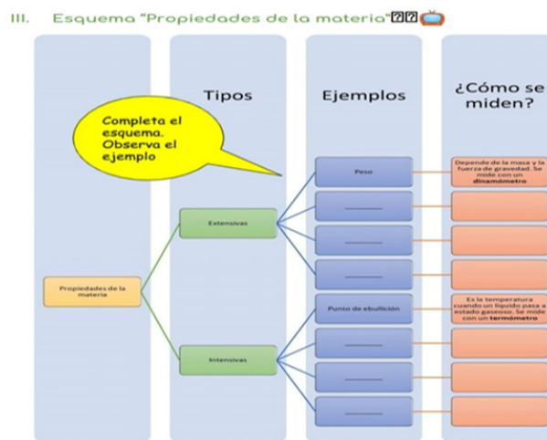
Figura 3. Extracto de la planificación del docente, caso 1.