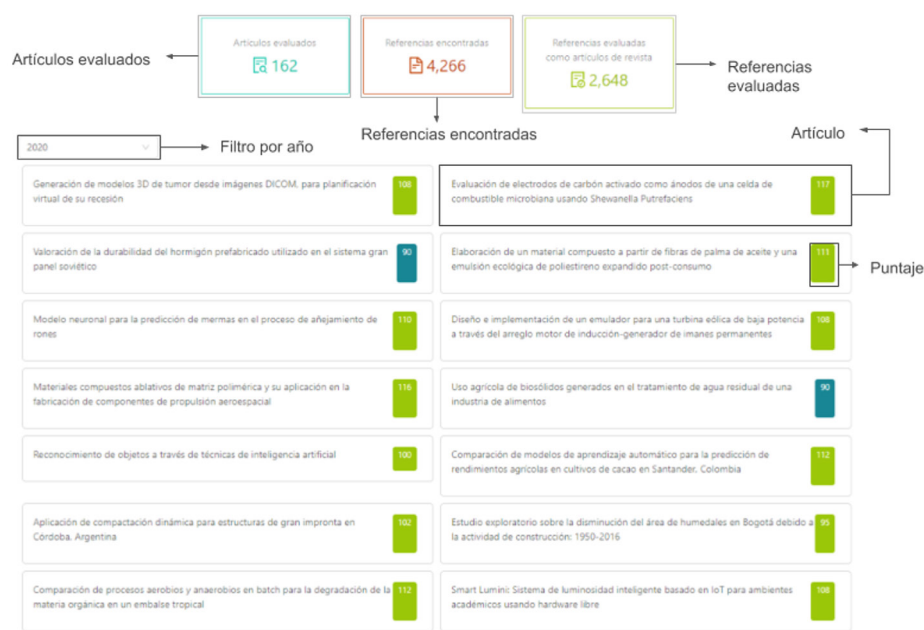
Figura 2. Pantalla de resultados de análisis