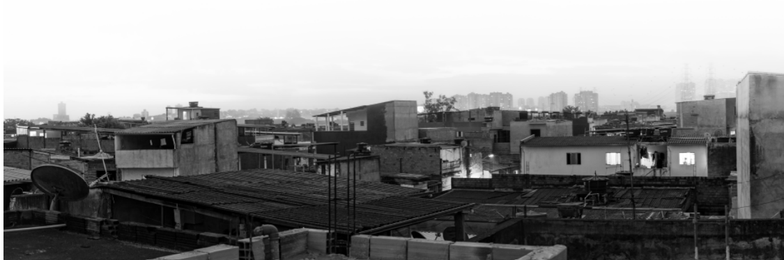
Figura 1. Imagem apresentada em projeto da selfie interior

Há também questões de identidade e reconhecimento nas imagens: a observação sobre os projetos selecionados revela alternância entre expressões de memória, trabalho e o olhar sobre aquilo que se vê e é visto. Cenas como as das figuras 1 e 2 do bairro de origem e lembranças familiares expressas por um aluno: “Quando pequeno eu havia pedido aos meus pais um irmãozinho para brincar, e recebi. [...] Eu dei o nome dele [...]”. Momentos de trabalho como uma tatuagem sendo finalizada (figura 3) ou um conjunto de imagens em um final de semana com significado pessoal (figuras 4), como diz o autor: “As fotos tiradas no ensaio são reflexos de alguns desses momentos que vivenciei no último final de semana, e seus significados realmente são subjetivos, por isso não me atentei em uma explicação concreta para cada uma, afinal, os sentimentos evidenciados quando as fotografias foram feitas pertenciam exclusivamente a aquela vivência, por exemplo, felicidade, tranquilidade, reflexão”. Ou mesmo de textura e cores em objetos como os da figura 5, a percepção de contrastes e de um distanciamento de materiais que ainda assim os torna próximos.