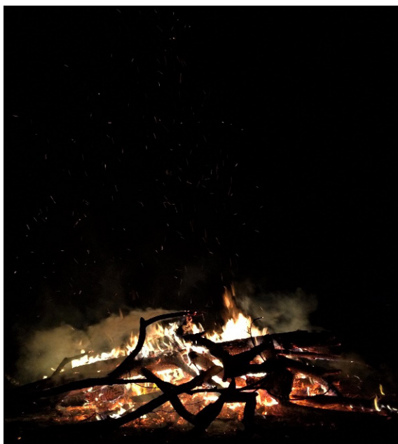
Figura 4. Imagem de trabalho apresentada em projeto da selfie interior