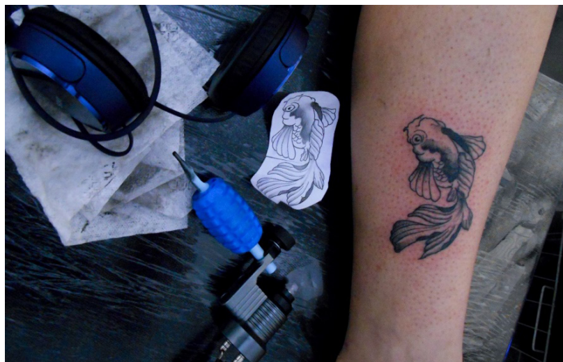
Figura 3. Imagem de trabalho apresentada em projeto da selfie interior