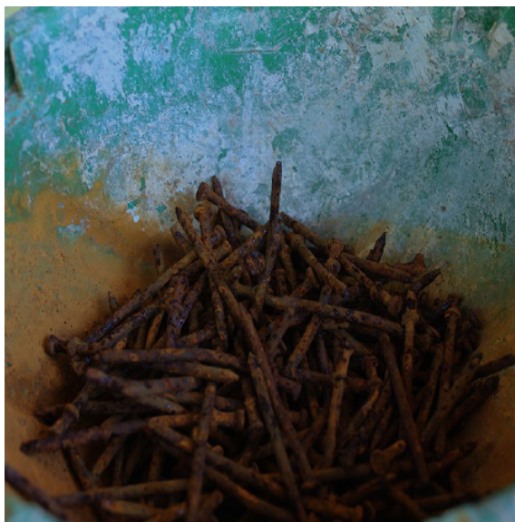
Figura 5. Imagem de trabalho apresentada em projeto da selfie interior