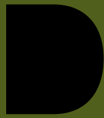
Tabla 2. Ficha de análisis