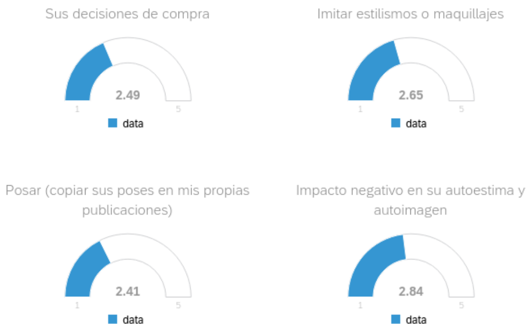
Figura 2. Influencia de las publicaciones de influencers en los usuarios