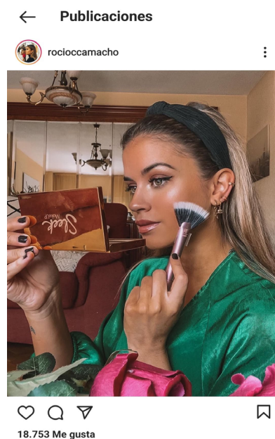
Figura 1. Publicaciones de Laura Escanes y Rocío Camacho