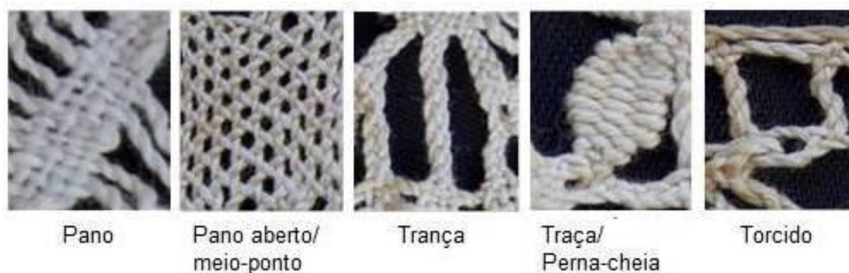
Figura 3: Pontos básicos de renda de bilros.

A partir do estudo dos pontos mencionados, analisando suas estruturas verifica-se que essencialmente há cinco diferentes pontos, podendo ser considerados como pontos de base, sendo eles: pano, pano aberto/meio-ponto, trança, trança/perna-cheia e torcido, ilustrados na Figura 3.