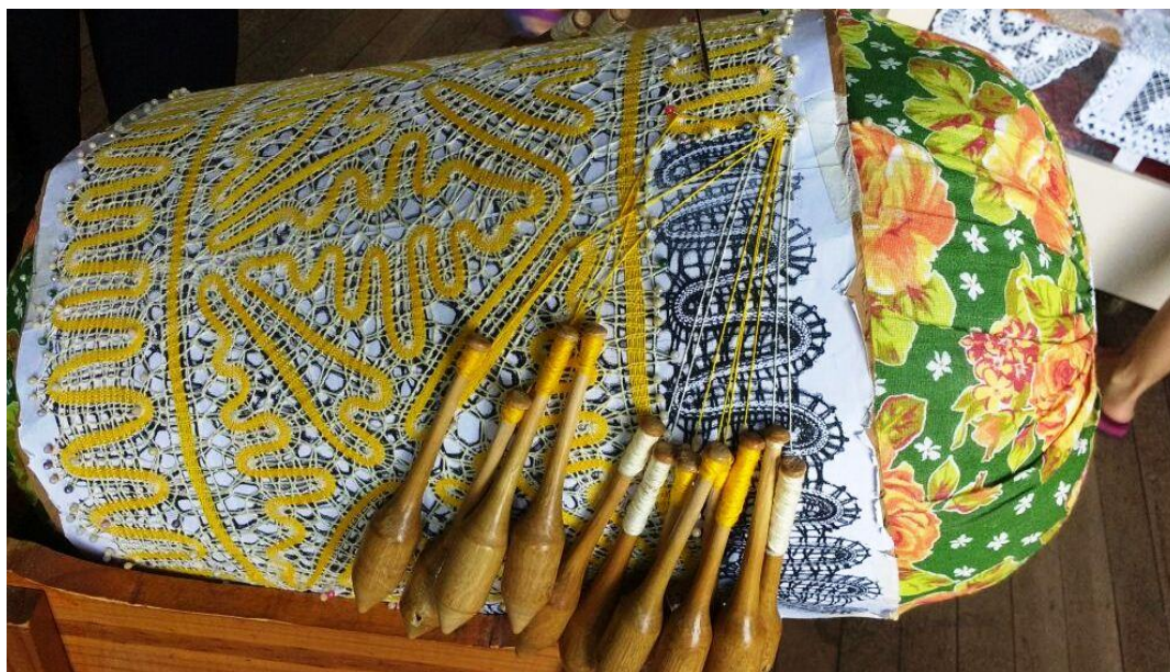
Figura 2: Novo formato de pique identificado em Florianópolis e utilizado por algumas rendeiras: papel branco com fotocópia da renda a ser tecida

As Figuras 1 e 2 foram obtidas em visita ao Casarão da Rendeira, no bairro Lagoa da Conceição, na cidade de Florianópolis e podemos ver claramente a diferença nos moldes presos às almofadas. Como é de costume, as rendeiras dificilmente criam novos desenhos de rendas e, fazendo uso das fotocópias, essa situação se reforça. As cópias são trocadas entre elas e reproduzidas sempre que necessário. Além disso, segundo Wendhausen (2015) é prático pela facilidade de ampliação e/ou redução do molde, o qual foi possível verificar na prática conforme Figura 2. E, por último, os alfinetes os quais são presença constante durante a tecelagem da renda, os quais substituíram os espinhos usados em épocas remotas, tendo como finalidade apoiar e direcionar os bilros no trabalho de tecer a renda.