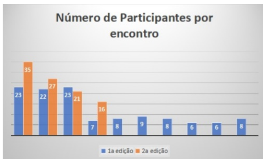
Gráfico 2 - Número de participantes que frequentaram os encontros do GEACE, por data, nas duas edições

O número de participantes, ao início e ao final da primeira edição (2016/2017) do grupo, afetou diretamente o planejamento da metodologia dos encontros, uma vez que, inicialmente, necessitávamos planejar contingências para disseminar a AC para um número maior de pessoas com formações e trajetórias heterogêneas no tocante relação à AC, à Psicologia e aos temas em discussão. Já nos encontros finais, um subgrupo de frequentadores mais assíduo e mais homogêneo participava, contribuindo para discussões mais aprofundadas. Com exceção de um participante, que tinha formação em Direito e foi selecionado para o Mestrado em Educação durante a vigência do grupo de estudos, os demais eram psicólogos ou estudantes de psicologia. Utilizamos as mesmas técnicas na segunda edição do grupo (2017); todavia, o nível de participação do grupo não foi o mesmo, nem entre os estudantes e profissionais de Psicologia que participaram dos encontros até o final, como destacado no Gráfico 2.