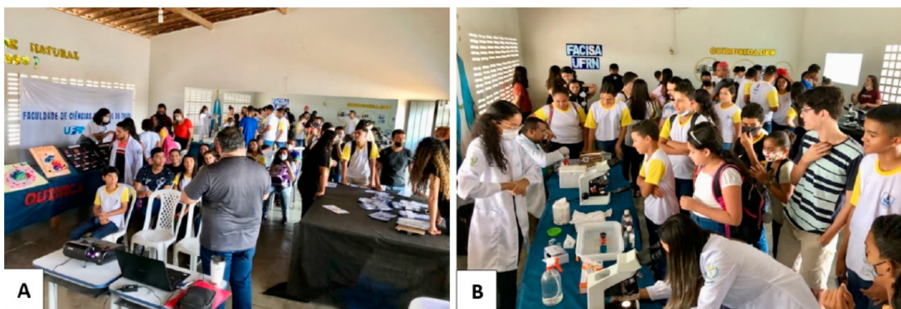
Figura 2: Realização do minievento para discentes da educação básica. Na imagem A, ao centro, destaque para a exposição dialogada sobre o tema saúde ambiental. Na direita da mesma imagem, ocorre apresentação de modelos didáticos e, na esquerda, aplicação de jogos didáticos. Na imagem B, à esquerda, ênfase para a realização de experimentos e visualização microscópica. Ao fundo, transcorre apresentação de curiosidades sobre o tema.