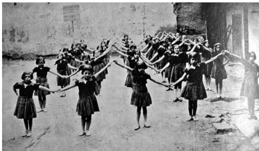
Figura 9. Niñas en clase de gimnasia

El poder de las imágenes en una u otra revista estaba en su capacidad de transformación o conservación de los hábitos, las creencias, las costumbres y los roles de los ciudadanos en la esfera privada; de hacer que los valores nuevos o tradicionales terminaran encarnándose en los cuerpos de los ciudadanos.