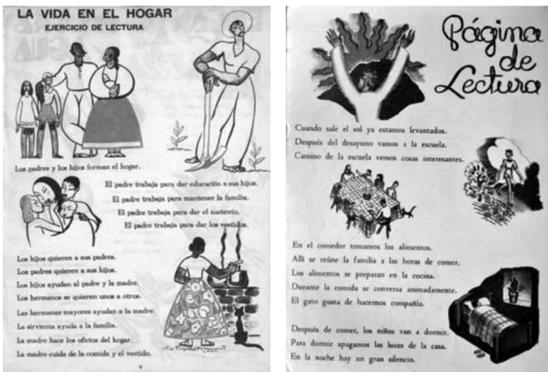
Figuras 3 y 4. Rin Rin n.ºs 4 y 10