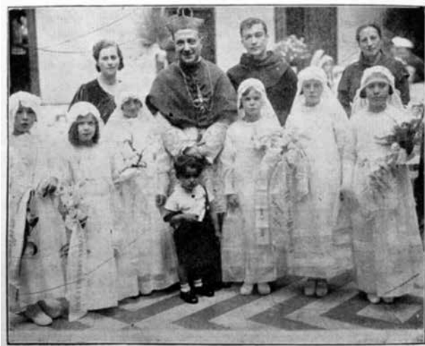
Figura 14. Niñas que hicieron la primera comunión en el colegio Chester

Este concepto podría también ejemplificar la toma de posición, en este caso, de Víctor E. Caro. Su relación con ministros evidencia que la postura del editor está cerca del gobierno (la Hegemonía Conservadora) y su centro y que, además, es él quien define el lugar que ocupan aquellos niños que no están en la élite. De acuerdo con el lugar donde esté ubicado el dispositivo reafirma la dominante axiológica: en este caso, la higiene moral, la limpieza de raza, toda la política eugenésica que se evidencia en acontecimientos (imágenes, fotografías e ilustraciones) y también en los textos que reflejan al ciudadano ideal: blanco, de élite, religioso, obediente, como los que se muestran a continuación (figuras 14 y 15).