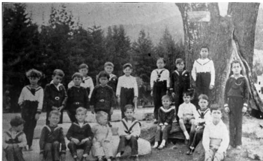
Figura 15. Niños en el jardín infantil de un colegio de Chapinero