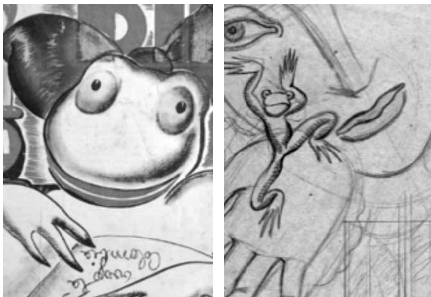
Figuras 10 y 11. Rin Rin , n.º 9 y 10