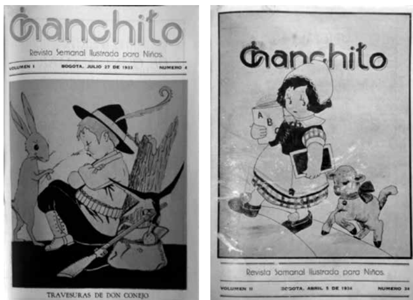
Figuras 12 y 13. Chanchito n.ºs 4 (1933) y 34 (1934).

Fuente: Caro, 1933, n.º 4; 1934, n.º 34,