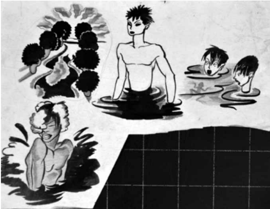
Figura 8. Dibujos en tinta para Rin Rin (1936)