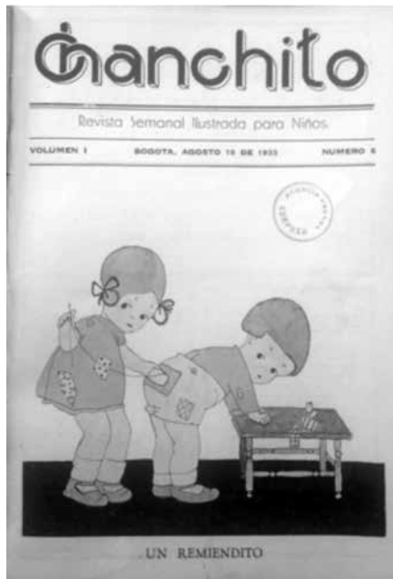
Figuras 1 y 2. Cubiertas de Chanchito n.º 6, “Un remiendito”, y 41