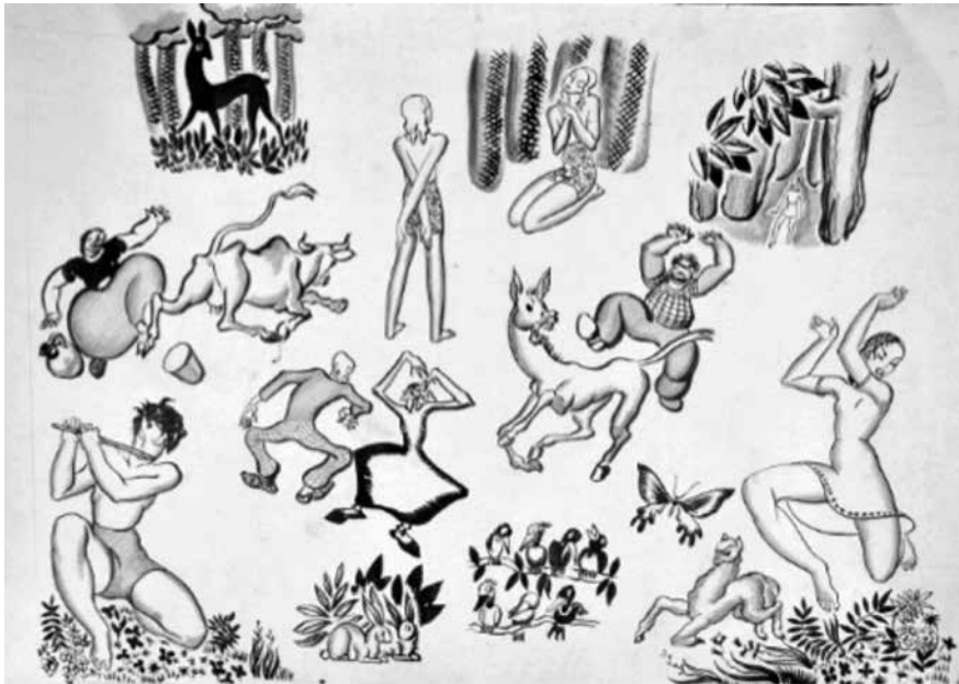
Figura 16. Dibujos en tinta para Rin Rin (1936)