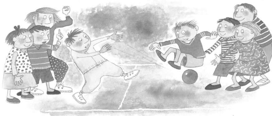
Figura 1. Ponchados